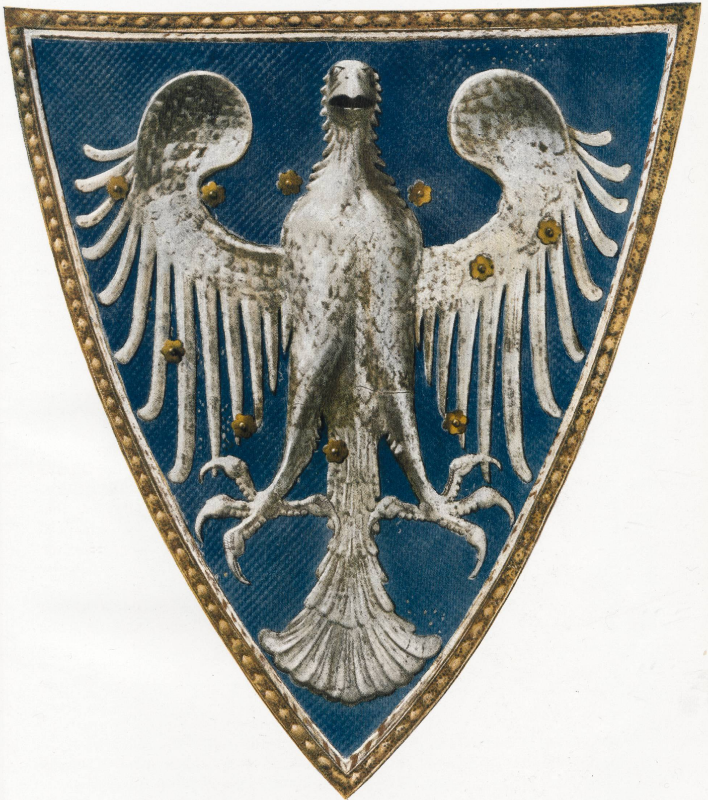
ÉCU DE RAROGNE (Musée de Valère à Sion)