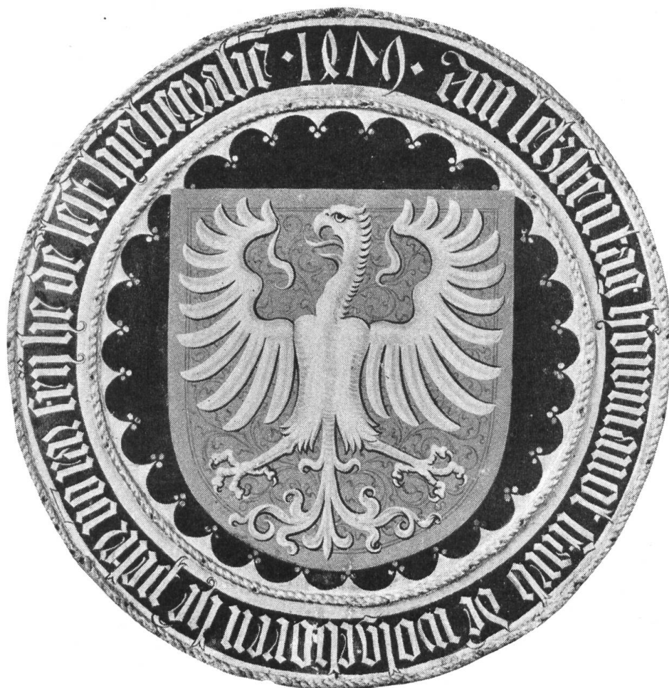
Fig. 16. Ecu mortuaire aux armes de Pierre de Rarogne.

fresque se trouvent deux écus d'or à l'aigle de sable , qui ne peut être que Rarogne. L'écu personnel de Guillaume, peint près de sa personne, est écartelé; au 1 Rarogne comme nous venons de l'énoncer; au 2 de gueules à l'aigle d'or , qui, d'après ce que nous savons de l'autre branche, ne peut être également que Rarogne; au 3 d'azur au château à deux tours d'or , qui est la seigneurie de Ville au Val d'Hérens, aussi dite Mont-la-Ville, possession très ancienne de la famille; enfin au 4 d'argent au basilic de sable, crêté de gueules , qui est l'écu des Urnavas de Naters, dont l'héritière Agnès était l'arrière-grand-mère de l'évêque.