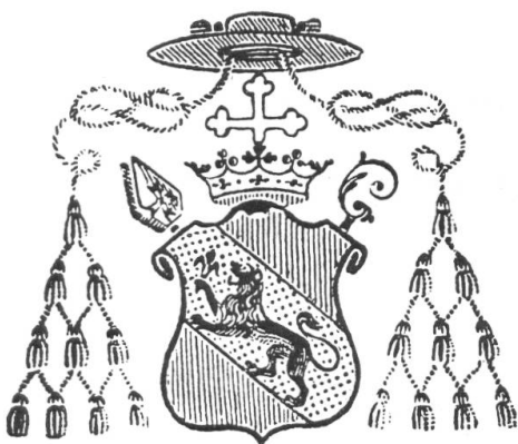
Fig. 85. Armoiries de Mgr Pierre-Joseph de Preux, évêque de Sion 1843—1875 ✓

Les Archives héraldiques ont publié en 1896 (page 14) un article intitulé: « Un évêque coadjuteur valaisan » signé du pseudonyme Lou** 1) et dans lequel l'auteur donnait la description des armoiries de Mgr Abbet (fig. 87) que le Grand Conseil de la République et Canton du Valais venait d'élire évêque coadjuteur de l'évêque alors en charge Mgr Jardinier qui, très âgé, ne pouvait plus remplir ses fonctions. Mgr Abbet ayant été présenté comme candidat par le Chapitre de Sion le 15 février 1895, le Grand Conseil le nomma coadjuteur de l'évêque de Sion avec droit de succession le 19 février suivant. Préconisé par le St Siège le 1er octobre il reçut le titre d'évêque de Troade in partibus , puis fut consacré dans la cathédrale de Sion le 2 février 1896. Mgr Jardinier mourut le 26 février 1901 et Mgr Abbet lui succéda alors effectivement comme évêque de Sion et occupa ce siège jusqu'à sa mort survenue le 11 juillet 1918.