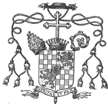
Fig. 87. Armoiries de Mgr Jules Maurice Abbet, coadjuteur dès 1895, évêque de Sion 1901—1918 ✓

Pour continuer dans nos Archives héraldiques l'étude des armoiries des évêques de Sion nous publions ici les armoiries de Mgr Bieler, successeur de Mgr Abbet. En application du nouveau droit ecclésiastique, le mode d'élection de l'évêque fut fixé par le St Siège par décision du 30 décembre 1918 et fut porté à la connaissance du Gouvernement valaisan. Le nouvel évêque fut désigné et nommé directement par le pape Benoît XV.