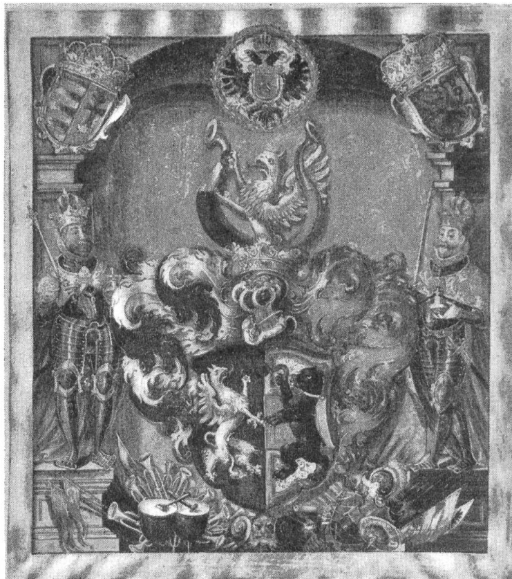
Fig. 30. Wappen aus dem Adelsbrief Rheiner, 1615

Die Urkunde besteht aus einem 25,5 \times 34 cm grossen, in dunkelgrünen Samt gebundenen Buch mit hellgrünen Bändern und enthält 10 Pergamentblätter und je ein Papierblatt vorne und hinten. Das erste, zweite und letzte Pergamentblatt