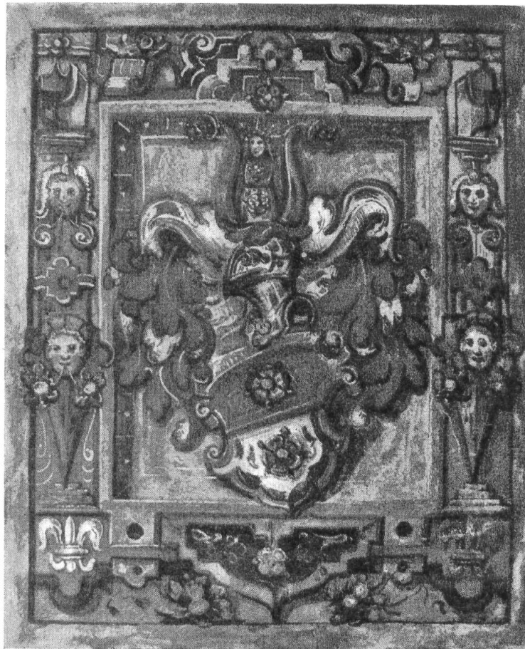
Fig. 28. Wappen aus dem Wappenbrief Spindler, 1602

Spindler, 1602. Zu Ende des 18. Jahrhunderts ausgestorbenes Geschlecht der Stadt St. Gallen, das ursprünglich aus dem Allgäu stammt. Hans wurde Bürger 1476. Die Spindler gehörten zu den Leinwandfirmen der Stadt, sie waren der „ade-