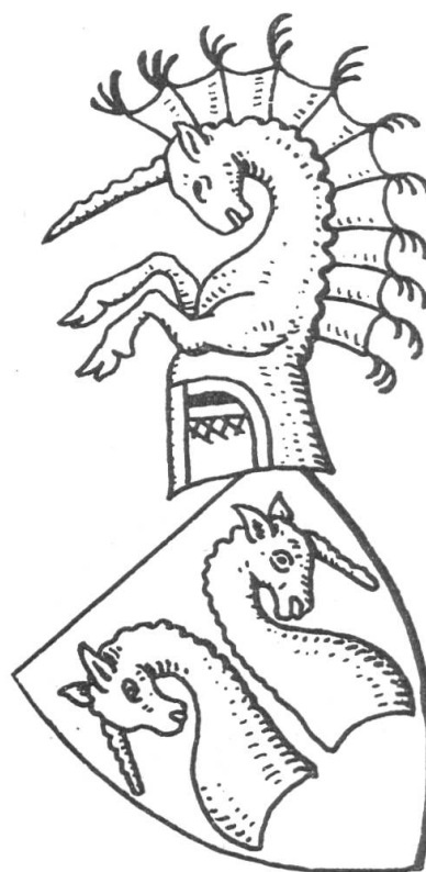
Fig. 103. Wappen der Herren von Iberg

J. STORER CLOUSTON, The Armorial de Berry . (Scottish Section). Proceedings of the Society of Antiquaries of Scotland. Vol. LXXII. Sixth series. — Vol. XII, 1938. P. 84/114, 11 planches en couleurs.