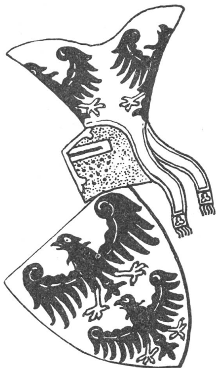
Fig. 102. Wappen der Grafen von Alt-Homberg

Notons pour les héraldistes que la publication de M. de Montfalcon est ornée d'une planche en couleurs reproduisant 20 armoiries de commandeurs de Compesières.