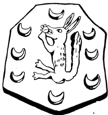
Fig. 2. Armoiries Musard dans la chapelle de la famille en l'église de Saint-Martin, à Vevey. Vers 1500.

Tous les catalogues de l'Ordre du Collier de Savoie, devenu plus tard de l'Annonciade, inscrivent à la première création de chevaliers Richard Musard et lui donnent une origine anglaise 1) . Le grand historien savoyard Amédée de Foras