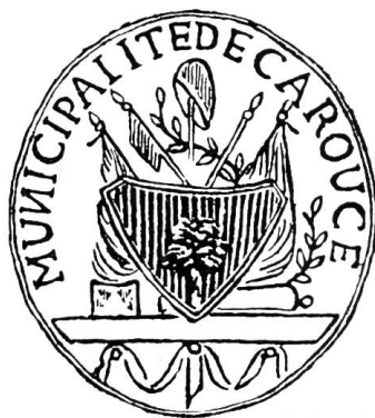
Fig. 6. Sceau de la Municipalité de Carouge, vers 1792.

Le champ des armes est souvent d'or, mais les plus anciens documents le donnent d'argent, ainsi celui que nous reproduisons, tiré d'un plan de la ville dressé en 1787 par J. M. Secretan (fig. 5). Les armes de Carouge sont donc : «d'argent au léopard au naturel, couché sur une terrasse de sinople et appuyé contre le fût d'un caroubier de même, fruité de gueules, planté sur la terrasse ». Supports : deux griffons affrontés. L'écu est sommé d'une couronne murale. Les couleurs communales sont rouge et vert.