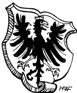
Fig. 9. Titelvignette eines Liedes « Zu Lob und Ehren denen von Frutigen ».

Entsprechend dem heutigen Brauche führen auf der Wappentafel im neuen Frutigbuch 1938 (Verlag Paul Haupt, Bern) Amt und Gemeinde dasselbe Wappen: In Silber ein schwarzer Adler mit goldener Krone und goldener Bewehrung (Fig. 8).