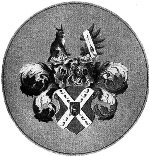
Fig. 10. Wappen aus der Copie des Adelsbriefes Girtanner v. Luxburg, 1776.

Die 3 Adelsdiplome, die wir in der Folge beschreiben, gehören sämtlich einer nach Deutschland ausgewanderten Linie an.