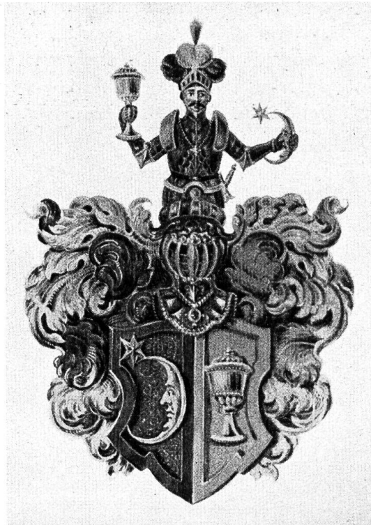
Fig. 13. Wappen aus der Copie des Familienvertrages Näf, 1830.