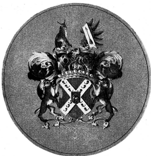
Fig. 12. Wappen aus der Copie des Grafendiploms Girtanner v. Luxburg, 1790.

Literatur : HBLS ; Bürgerbuch St. Gallen 1940 ; Næf, Burgenwerk.