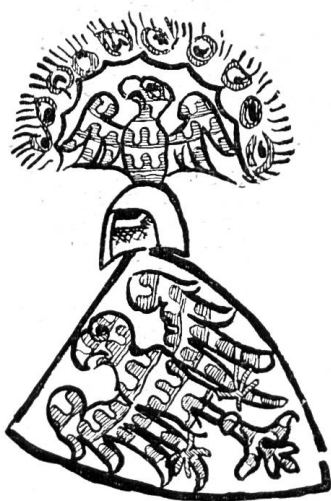
Fig. 58. Wappen der Grafen von Froburg, nach der Zürcher Wappenrolle, ca. 1340.

Auf die erlauchte Herkunft der Grafen von Froburg, welche ursprünglich ein fränkisches, in Ober-Lothringen sesshaftes Geschlecht waren, das zu seinen Ahnen sowohl die Merowinger als auch die Karolinger und speziell Kaiser Lothar zählte, möchten wir hier nicht näher eingehen, sondern uns mit dem Hinweis auf die vortreffliche Untersuchung von Dr. August Burckhardt «Die Herkunft der Grafen von Froburg» 1) begnügen. Neben einer besonders grossen Zahl von ihnen abhängiger