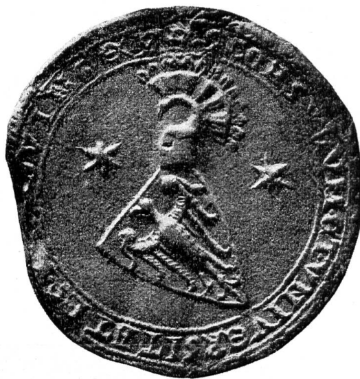
Fig. 59. Siegel der Stadt Zofingen mit dem Vollwappen der Froburger, 1278 VII 23.

Ministerialen hatten die Grafen von Froburg auch eigene Hofämter, wie solche von oberrheinischen Dynastenhäusern nur noch die Grafen von Lenzburg und von Habsburg besaßen. Sowohl Ministeriale als Hofbeamte führten das gleiche Schildbild, den sogenannten Spitzenschnitt, in verschiedenen Tinkturen (Fig. 60 und 61); er weist daher, wo wir ihn am Oberrhein finden, immer mit grosser Wahrscheinlichkeit auf die Froburger hin.