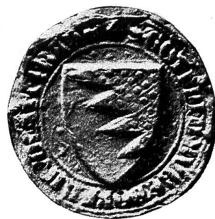
Fig. 61. Siegel Gottfrieds von Bubendorf, Vogt von Baden, 1336 III 9.

Ihre Stammburg lag auf einer fast allseitig sturmfreien Felskuppe des untern Hauensteins, hart an der Grenze des Sisgaus und Buchsgaus, dessen Grafschaft die Froburger als bischöflich baslerisches Lehen verwalteten. Auf der Froburg suchten 1308, weil sie ausserhalb der Landgrafschaft Aargau lag, die Mörder