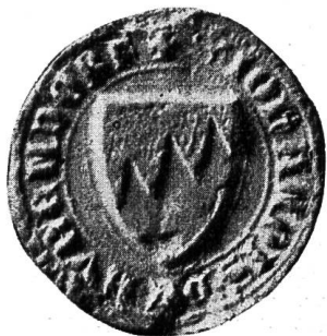
Fig. 60. Siegel Johans von Bubendorf, 1337 V 19.

Im Streit zwischen Papst und Kaiser erwiesen sie sich als getreue Diener der Kirche und nahmen Partei gegen das Reichsoberhaupt. Durch übermässige kirchliche Stiftungen und Vergabungen kam das ursprünglich und bisher so reiche Haus in eine pekuniär höchst bedenkliche Lage. Der fortschreitende finanzielle Ruin zwang die Grafen, ein Besitzstück nach dem andern zu verpfänden oder zu verkaufen, was ihre politische Macht und Aktionsfreiheit natürlich empfindlichst hinderte und lähmte. Nicht mehr imstande, die Konkurrenz der aufstrebenden Habsburger auszuschalten oder gar zu paralysieren, endeten sie im letzten Viertel des vierzehnten Jahrhunderts als ein verarmtes Geschlecht.