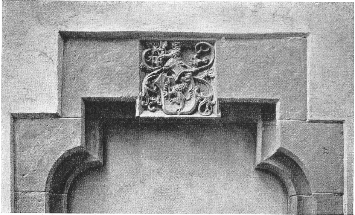
Fig. 95. Türeinfassung im Totengässlein in Basel.