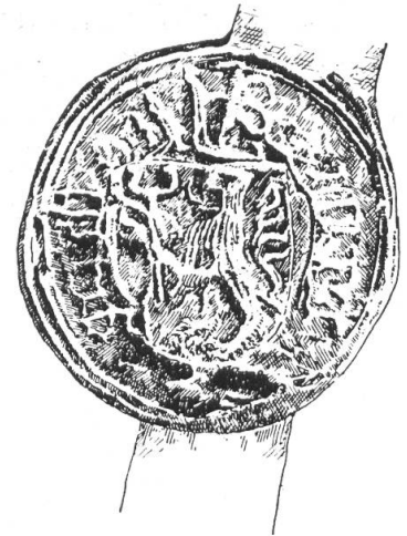
Fig. 97. Siegel des Ludwig Gsell, 1477.