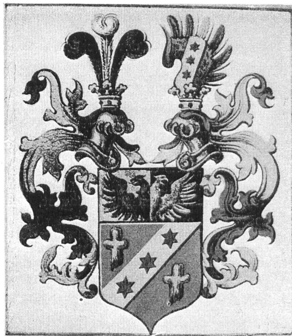
Fig. 100. Wappen aus der Copie des Ritterstandsdiplomes v. Westenholz, 1866.

vertrat erfolgreich die militärischen, politischen und volkswirtschaftlichen Interessen Österreichs.