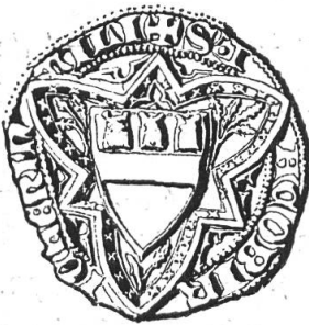
Fig. 111. (3/2)