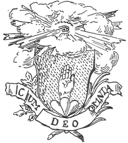
Fig. 110. Handtmann (n° 96).