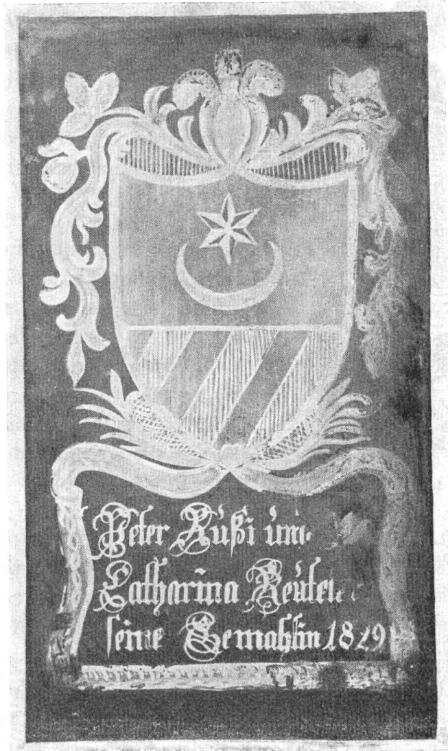
Fig. 89. Schliffscheibe Russi.

Wappen : In Weiss ein roter Löwe (Gatschets Wappenbuch 1799, Schiffscheibe Balth. Rufj 1796, Privatbesitz Bern).