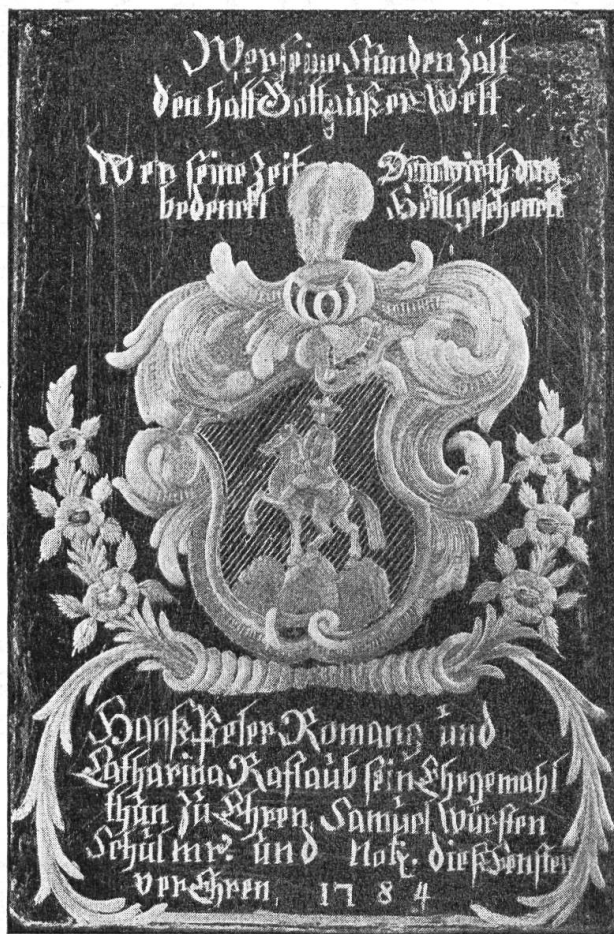
Fig. 88. Schliffscheibe Romang.