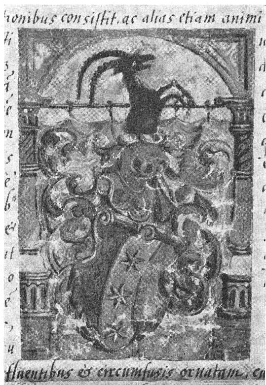
Fig. 101. Wappen aus dem Adelsbrief Schucan, 1549.

Lit. : Hartmann, Ausgest. Geschl. ; U. St. G. ; OBG II/184 ; LL ; Vadian : Deutsche Schriften ; Kessler : Sabbata ; HBLS.