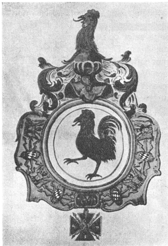
Fig. 104. Wappen aus dem Komturiatsdiplom Blarer v. Wartensee, 1750.

und einer grauen antiken Büste in goldenen Füllungen. Auf hell- und dunkelgrau geschachtem Boden steht der Barockwappenschild, dessen Oberteil in zwei goldene Cherubime ausläuft. Im Gegensatz zur Blasonierung sind die Felder 1 und 4 bläulich, ebenso sind die rechten Helmdecken rot-blau. Es kann sich um nachträgliche Blauverfärbung der ursprünglich weissen Farbe handeln. Dahingegen zeigt die rechte Helmzier einen goldenen Schnabel und eine goldene Zunge (Fig. 103).