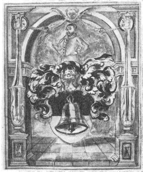
Fig. 102. Wappen aus dem Adelsbrief Schaupp, 1592.