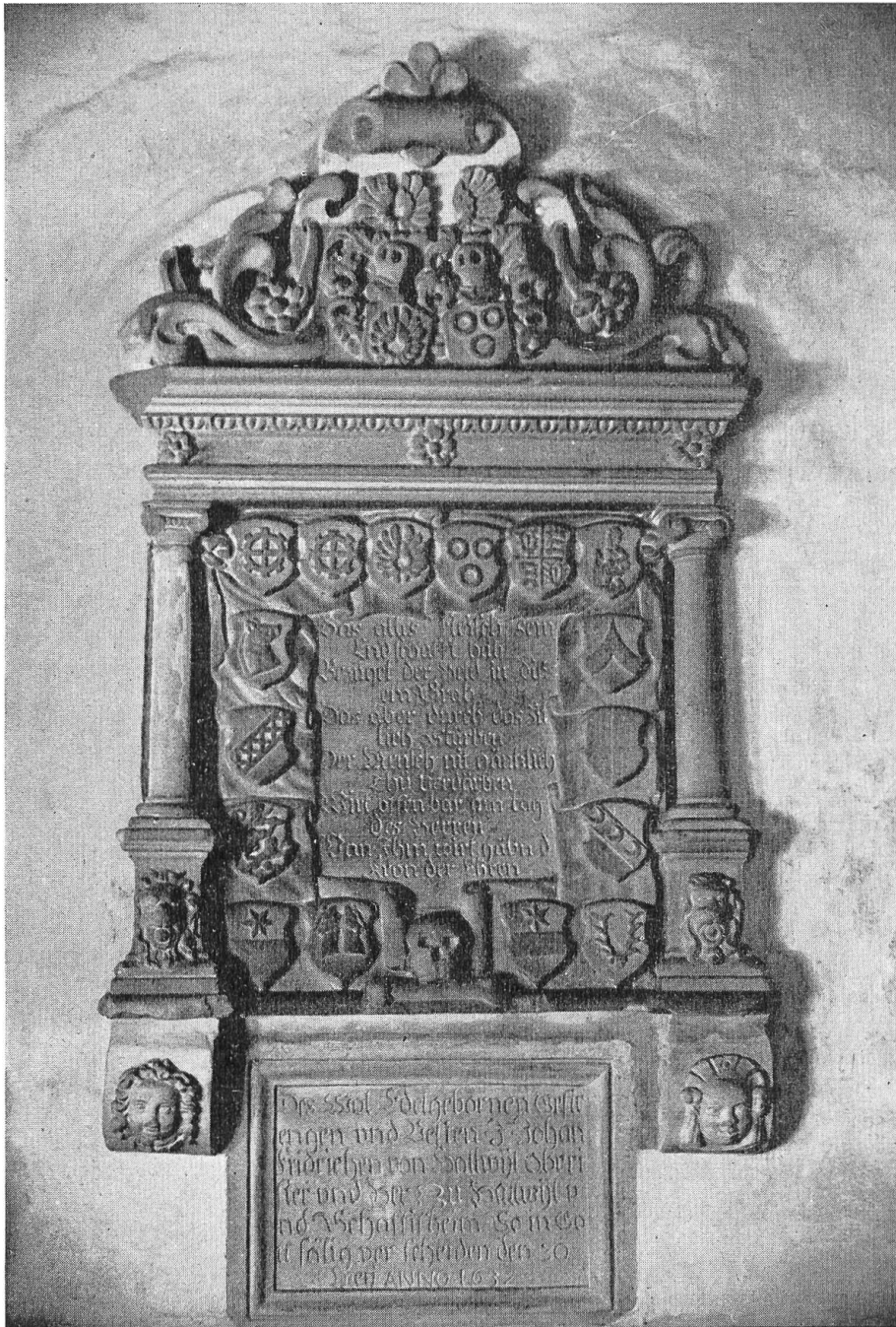
Fig. 109. Hallwil-Epitaph, 1637. Kirche von Staufberg, Aargau.

einen kulturhistorischen Wert, denn aus den Wappen und der Zugehörigkeit ihrer Eigentümer zu gewissen Rittergesellschaften lassen sich noch Rückschlüsse auf Stand und familiäre Beziehungen, die zu Ehegenossenschaften führten, ziehen. So gehörten der Turniergesellschaft vom « Gekrönten Steinbock » die von Goldenberg und von Helmstorf, der vom « Fisch und Falk » die von Reischach und derjenigen vom « Leitbrack und Kränzlein » die von Hürnheim, von Ehingen und von Neunack an.