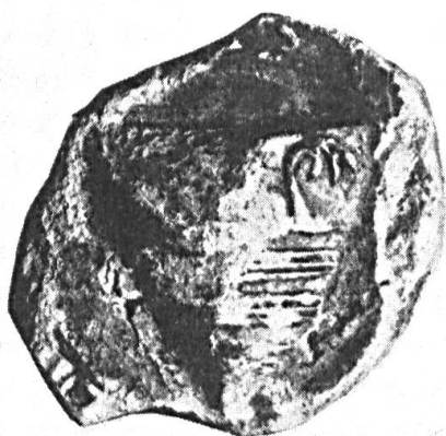
Fig. 47. Arnoud van Beke, 1266. S'AR.....