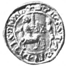
Fig. 52. Bastard, schepen van Hulst, 1276. + SIG BASTARTI .ATIS S..NE.

D'autre part, le développement des armoiries nobiliaires a été plus rapide. Quand l'héraldique bourgeoise eut adopté l'écu pour y placer ses emblèmes, un arrêt se produisit dans son développement. Les bourgeois prenant part à la guerre faisaient usage d'écus, aussi le droit de porter l'écu ne leur était-il nullement contesté. Il n'en était pas de même en ce qui touche le casque et le cimier ; c'est pour cette raison que ces objets ne furent utilisés que beaucoup plus tard, par esprit d'imitation et dans un but décoratif. Ce n'est qu'avec beaucoup d'hésitation que cet usage nobiliaire fut adopté par la bourgeoisie. De même, l'emploi d'accessoires décoratifs dans l'héraldique bourgeoise des Provinces Septentrionales, fut toujours relativement restreint.