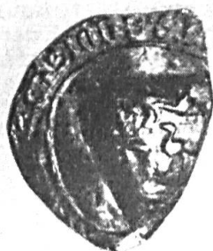
Fig. 44. ✓ Godfried Hundertmarc, 1253. + S'G (odefridi hundertma)RC SCABINI.