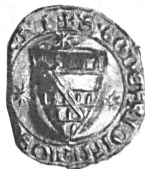
Fig. 45. ✓ Godfried Osenzoon, 1256. + S.GODEFRIDI FILII OS(e scabi)NI.

C'est dans le territoire actuel des Pays-Bas que la bourgeoisie parvint d'abord à s'élever jusqu'aux plus hautes charges et qu'elle obtint les plus grands honneurs ; c'est donc naturellement dans ce pays que l'on doit trouver les plus anciennes armoiries bourgeoises. Dès 1248 Nicolaas van Putten, bourgeois de Middelbourg, faisait usage d'un sceau 1) , sans écu, portant une aigle (fig. 43). En 1253 Godfried Hundertmark, échevin de Maestricht, employait déjà un sceau sur lequel figure un écu portant 6 oiseaux, 3, 2 et 1 (fig. 44).