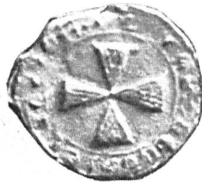
Fig. 51. Gherard Yensoene, 1297. Légende illisible.