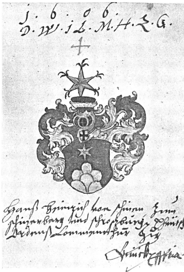
Fig. 56. Hanss Heinrich von Schiner zum Schinerberg und Schrozburg, Theutsch O. Comm.

Lass Dir bei Zeit unrecht thun, So kommst Du desto balder darum. Basel den 29 Novembris Ao. 1620.