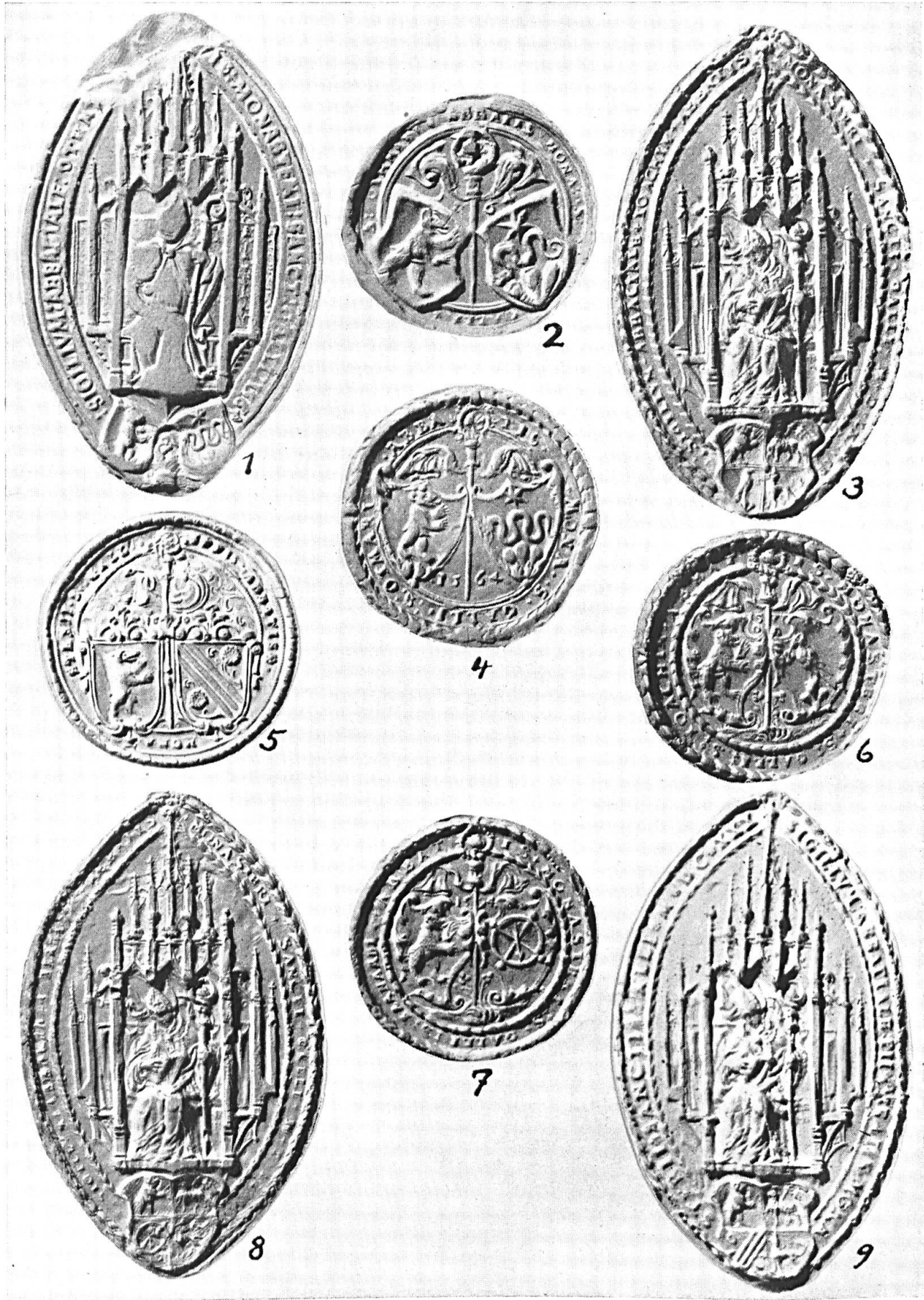
Die Siegel der Fürstbische von St. Gallen, V

1., 2. und 4. Otmar Kunz, 1564-1577. — 3. und 6. Joachim Opser, 1577-1594. — 7. und 8. Bernard Müller, 1594-1630 — 5. und 9. Pius Reher, 1630-1654.