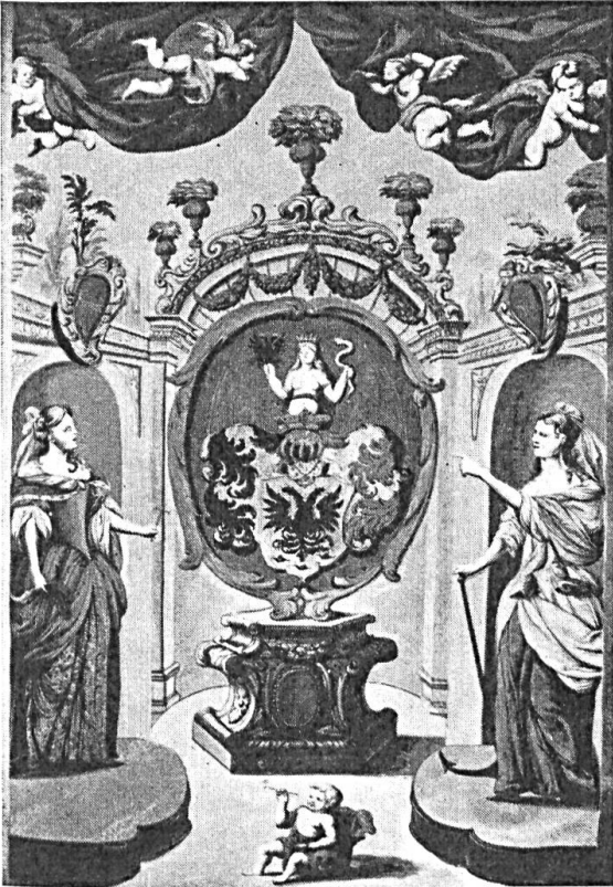
Fig. 74. Wappen der Lumaga im Wappenbuch der Stadt Wien (1675). ✓