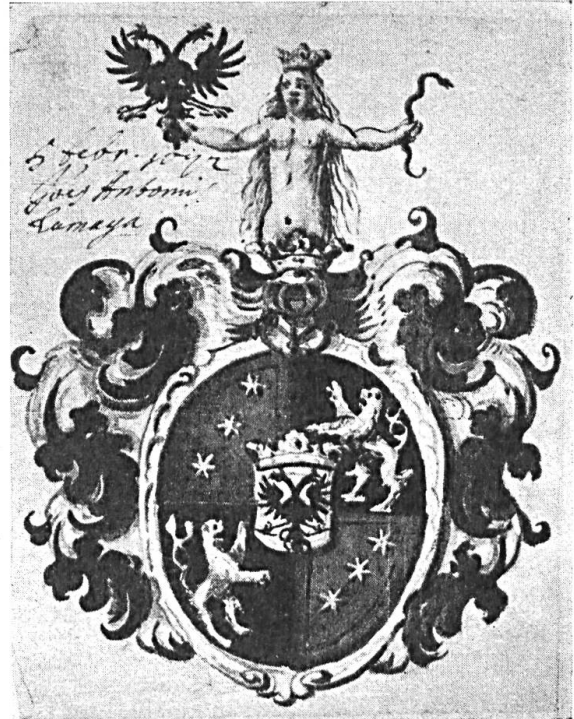
Fig. 75. Wappen des Adelsbriefes von 1672.