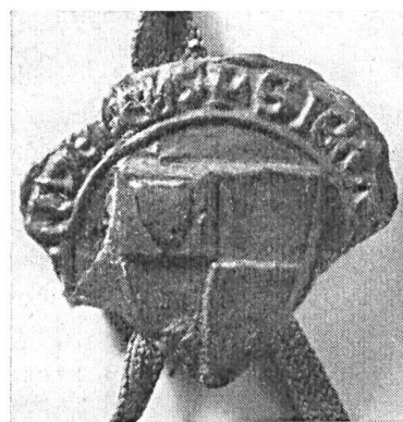
Fig. 81. Sceau de Jean III, châtelain de Lens, 1287.

la légende : S:JOHIS:CASTELLAIN:DE:LENS 18 ). En 1272, une vieille généalogie, rapportée par Rodière 19 ) signale un acte perdu scellé par Jean III d'un sceau à l'écu écartelé, avec contre-sceau à l'aigle éployée, à deux têtes (l'aigle des Lens a d'ordinaire une seule tête, contournée). En février 1275, magnifique sceau de 65 mm. avec l'écu écartelé et la légende : S:JOANNIS:CASTELLANI:DE:LENS: MILITIS et contre-sceau la même légende 20 ). Un acte de novembre de la même année porte un sceau de 58 mm. de même type, légende : S:JOHANNIS:CA.. ..:LENS:MILITIS, contre-sceau de 29 mm. portant une aigle, légende : S:JOHANNIS:CASTELLANI:DE:LENS 21 ). En 1287, deux sceaux de Jean III et de sa femme, Isabelle, sont empreints sur de la cire noirâtre ; celui de Jean, rond, de 38 mm., porte un écu écartelé, le premier quartier chargé d'un écusson, légende : S:JEHA... ..N:DE:LENS (fig. 81). Il ne reste qu'un fragment de celui de sa femme dont on ne voit que la partie médiane du corps accompagnée d'un écu écartelé très net 22 ). Les archives du comte de Bucquoy conservaient un sceau de Jean III, à la date de 1293 : 61 mm., type équestre, écartelé de plains sur l'écu et sur la housse du cheval, légende détruite, contre-sceau de 30 mm. avec une aigle à la tête contournée et la légende : ...CASTELLANI:DE:LENS 23 ).