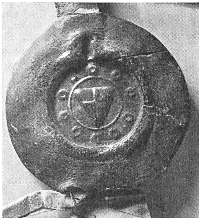
Fig. 79. Contre-sceau de Baudouin IV, châtelain de Lens, 1242.

Le même type équestre avec l'écu écartelé se trouvait sur un sceau de 61 mm. (1248) avec la légende : +S.BA..UI... ..ANI.DE.LENS ; contre-sceau de 33 mm. avec écu écartelé entouré de dix annelets 13 ). Un sceau de 1250 est semblable 14 ) et un fragment de sceau, appendu à un acte de 1262, porte un écu écartelé 15 ).