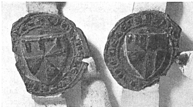
Fig. 82 et 83. Sceaux de Philippe d'Aubigny et de sa femme Isabelle de Lens, 1321.

Jean IV (1301 - 1307) scella cette même pièce d'un sceau de 41 mm. ; l'écartelé de l'écu présente en franc-canton, un lion léopardé, légende : ...E:LENS:CHEVALIERS. C'est le seul sceau subsistant d'un des plus glorieux capitaines des campagnes de Flandre, et il date d'une époque où il n'était encore qu'héritier. On trouve l'écartelé sur le sceau de sa femme, Marie d'Esne, dame de Cauroy, datant de décembre 1305 : sceau en navette de 53 mm., avec deux écus, à dextre un émanché de cinq pointes, à sénestre, un écartelé 24 ).