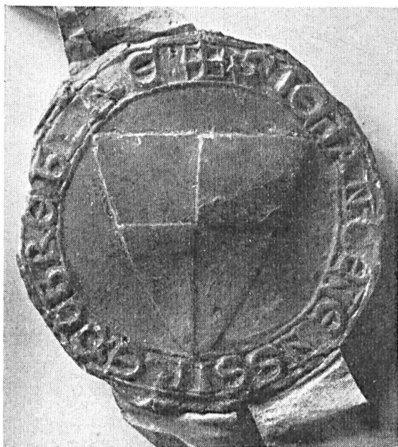
Fig. 80. Sceau de Jean II, sgr. de Brebières, 1243.

BREB, l'autre, d'octobre 1250, du même type, légende : SIG:JEHAN:DE:LENS: SIRE:DE:BREBIRE 17 ).