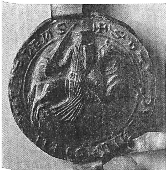
Fig. 78. Sceau de Baudouin IV, châtelain de Lens, 1242.

nous montre un écu écartelé entouré de dix annelets, légende détruite 10 ). En septembre 1225, autre fragment avec écu écartelé, légende détruite 11 ). Le plus beau spécimen de la série est le sceau, en parfait état de conservation, appendu à un acte du 16 novembre 1242 ; de 70 mm. de diamètre, il est de type équestre avec écu écartelé et la légende : S:BALDUINI:CASTELLANI:DE:LENS ; le petit contre-sceau porte l'écu écartelé entouré de douze annelets (fig. 78 et 79) 12 ).