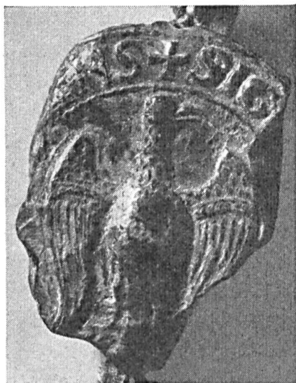
Fig. 77. Sceau d'Eustache I, châtelain de Lens, 1206.

Les deux sceaux d'Eustache, châtelain de Lens (1169 - 1209) portent encore l'aigle sans écartelé : le grand sceau de 55 mm. est appendu à un acte de janvier