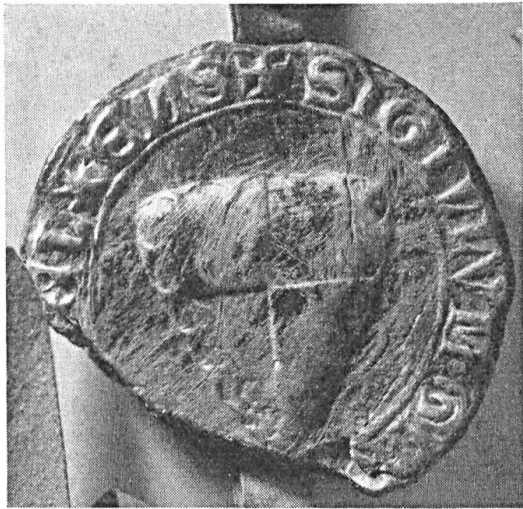
Fig. 97. Sceau de Gérard de Lens, sgr. de Reninghelst, 1222.

d) Lens-Rebecque : Renaud, seigneur de Rebecque, le plus jeune frère de Baudoin IV, scelle un acte de 1251 d'un sceau de 55 mm. avec un écu écartelé à l'orle de 11 besants, légende : S:RENALDI:DE:LENS 35 ). Ses descendants, qui prennent le nom de La Couture, adoptent comme brisure le lambel de trois ou cinq pen-