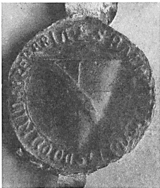
Fig. 99. Sceau de Baudouin I de Lens, sgr. de Brebières, 1266.

25 mm., écartelé à la bande, légende : BAUDOUIN:SIRES:DE:LOU... 42) ; l'autre, du 12 janvier 1315, même écu, légende brisée 43) . Un frère cadet de Baudouin II, Gossuin de Louwez, scelle le 16 mars 1315 d'un sceau de 28 mm., à l'écartelé à la bande et à la bordure engrêlée, légende : S:GOSSUIN:DE:LAUWES:CHRS 44) . Les descendants de cette branche, les Hourde et les Louvers, ainsi que les Du Mont, scellent d'un écu écartelé aux 1 et 4 d'or à la bande de gueules, aux 2 et 3, de sable plain.