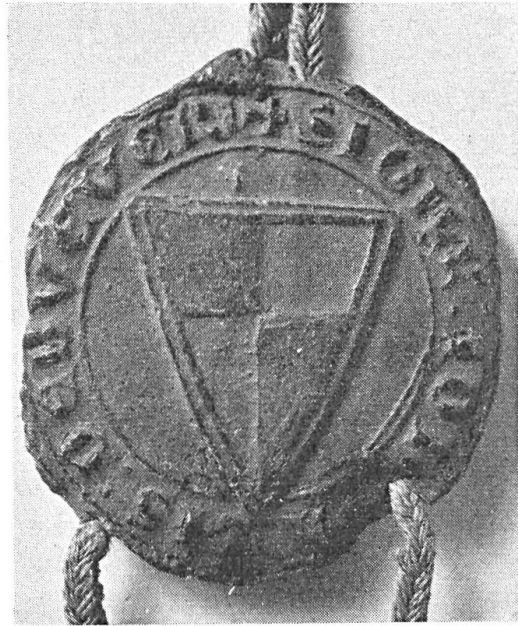
Fig. 98. Sceau de Jean de Lens, sgr. de Beuvry, 1259.

dants. Citons les sceaux de Jean I (1259), 46 mm., lambel à cinq pendants, légende : S:JE... ..ELECOURT... 36 ) ; Jean II (1284) lambel à trois pendants, légende : SIGILLUM... ..USTURE) 37 ) ; Jean III (15 janvier 1315) 36 mm., lambel à trois pendants, légende : S:JEHAN:DE:LA:COUTURE:CHLR:SI...S... ..DE:REBECQUE 38 ) ; Jean IV, 23 mm., écartelé au lambel, légende : SI... ..DE:REBECQUE 39 ). Les Lens-Rebecque, qui se continuent par des cadets jusqu'en 1830, portent encore au XV e siècle l'écartelé au lambel 40 ).