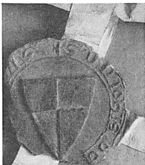
Fig. 101. Sceau de Jean II, sgr. d'Hulluch, 1288.

sans légende 51 ) ; même sceau le 13 août 1306. En 1288 et 1299, Eustache de Hulluch, seigneur de la Hamaide à Hénin-liétard, frère de Jean II, scelle d'un écartelé au lambel d'ailleurs à peine distinct par suite de l'écrasement de la cire (fig. 102) 52 ).