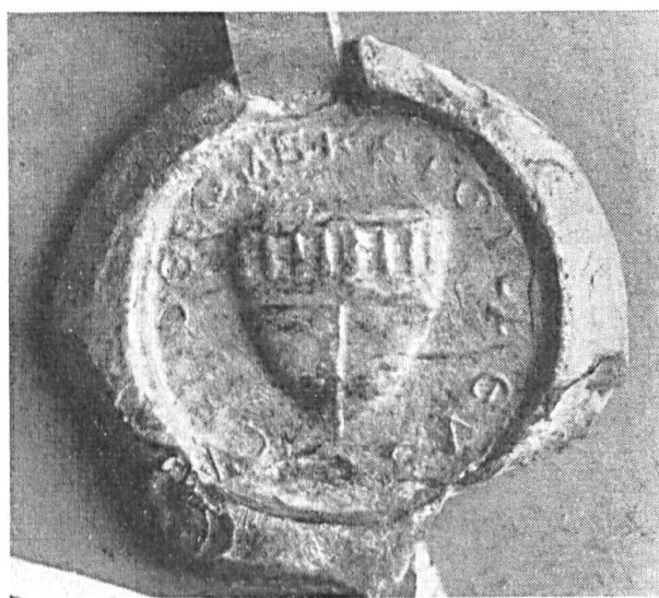
Fig. 96. Contre-sceau d'Eustache II, sgr. de Choques , 1223. ✓

b) Lens-Reninghelst : Gérard, frère de Baudoin IV, nous a laissé deux sceaux : l'un de 1222, 54 mm., écu écartelé à la bordure engrêlée, légende : SIGILL...GER... ..E:LENS (fig. 97) 30 ). L'autre, de janvier 1237, a 58 mm., écu écartelé à la bordure chargée d'une bordure ondulée, légende : S:GERARDI:DE:LENS 31 ). La fille de Gérard, Béatrice, dame de Reninghelst, aurait scellé un acte de 1285 d'un sceau à l'écartelé avec bordure 32 ).