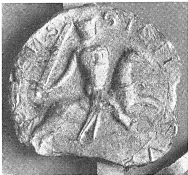
Fig. 95. Sceau d'Eustache II de Lens , sgr. de Chocques, 1223. ✓

a) Lens-Chocques : Eustache, seigneur de Chocques, frère du châtelain Jean I, nous donne deux sceaux : le premier (janvier 1223) a 58 mm., type équestre, écu écartelé au lambel de huit pendants, légende : SIGILL: :EUS... ..DE:LENS (fig. 95) 28 ). Le contre-sceau présente les mêmes armes et la légende : SIGILL.EUS TACHII:DE:LENS (fig. 96). Un second sceau, de 1230, porte le même écartelé au lambel de huit pendants 29 ).