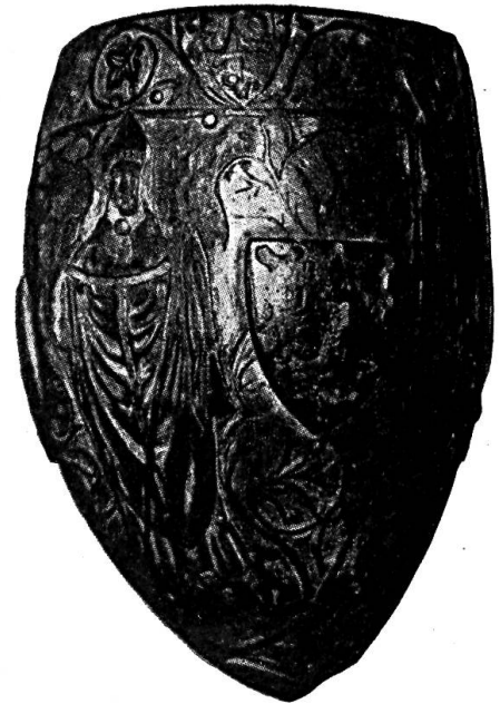
Fig. 43. Boîte de courrier.