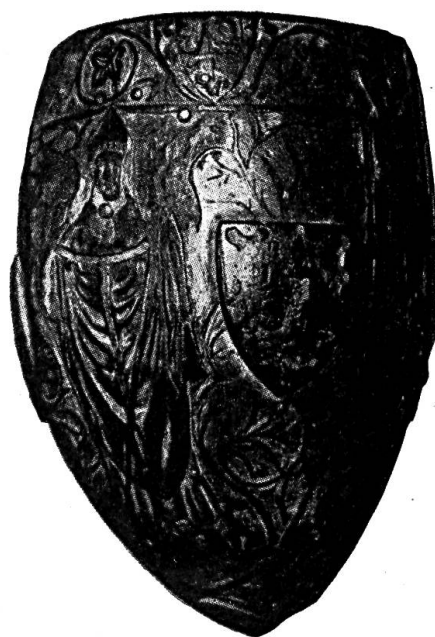
Fig. 43. Boîte de courrier.