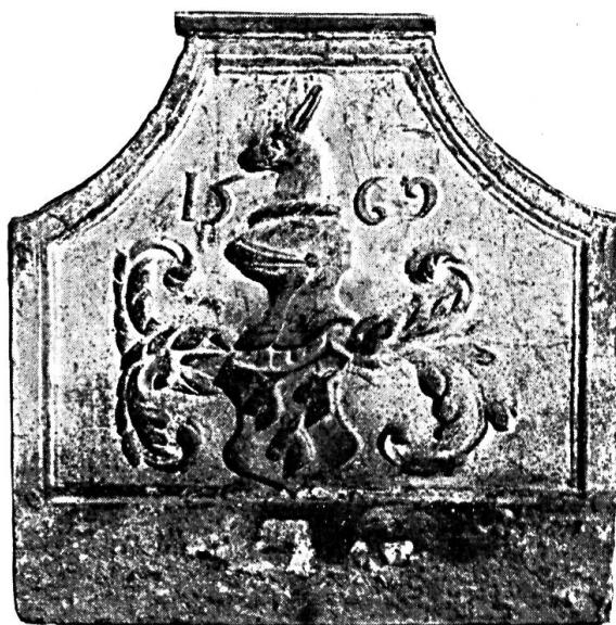
Fig. 44. Plaque de cheminée aux armoiries inconnues.

Armoiries inconnues. La fig. 44 représente une plaque de cheminée provenant d'un ancien chalet de Les Bioux-Dessus (Vallée de Joux). La date la plus ancienne de cette construction paraît être 1685. Il serait intéressant de pouvoir identifier les armes de cette taque, trois têtes d'âne, qui ne sont certainement pas très répandues.