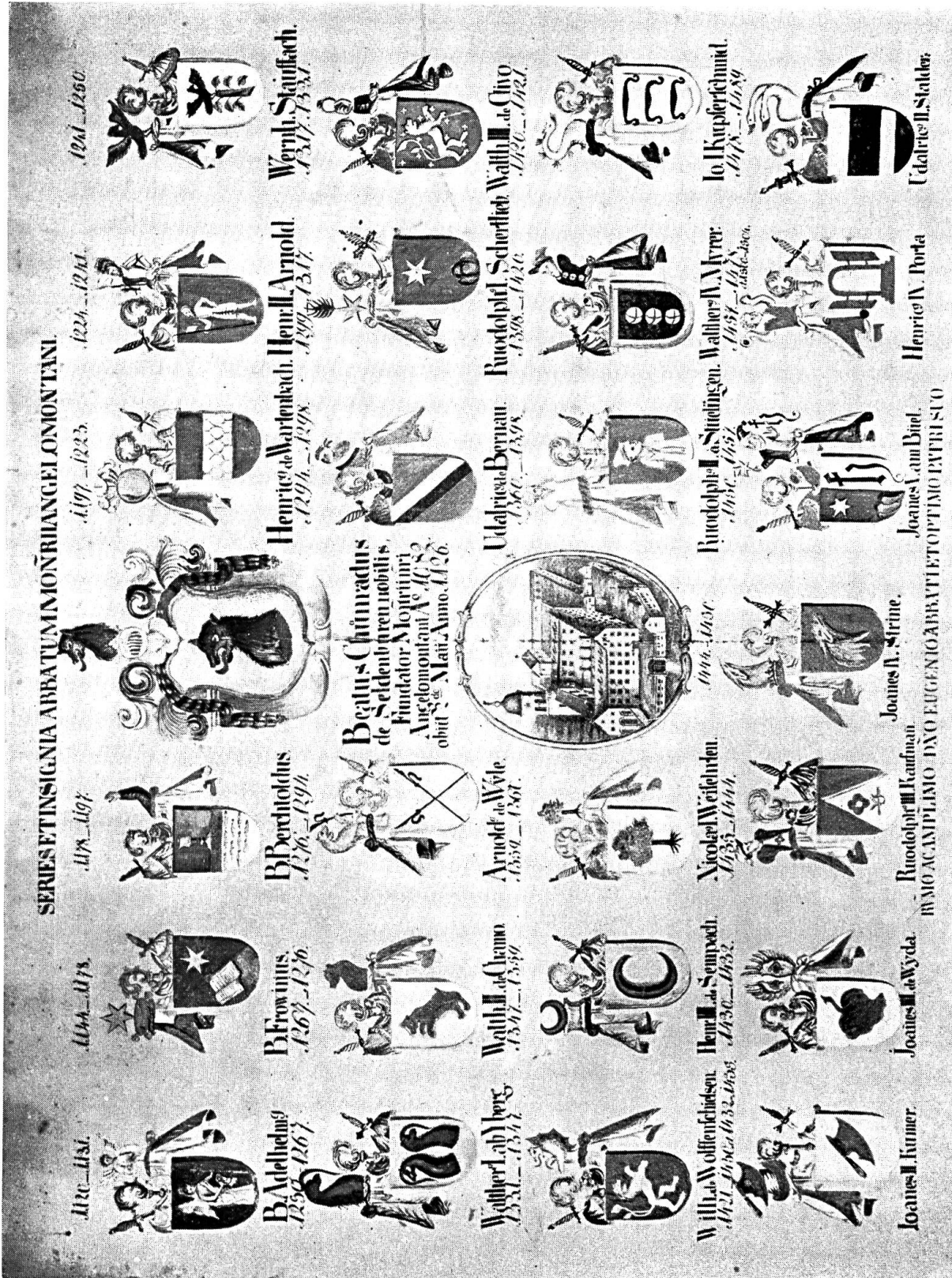
I. Wappentafel der Aebte von Engelberg.