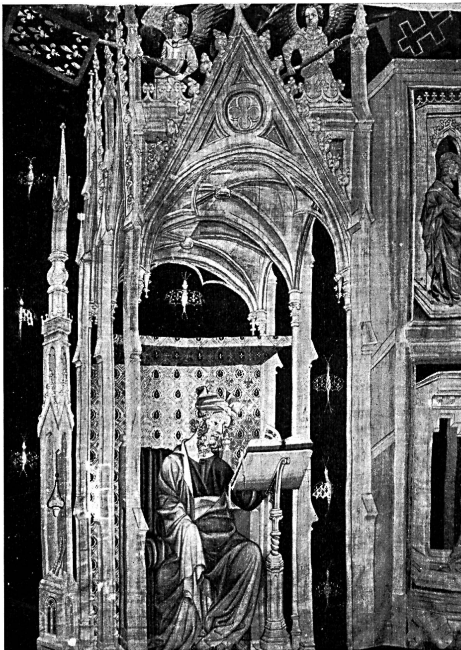
Fig. 97. Une des tapisseries d'Angers.

Tapisseries et héraldique. La « Kunsthalle » de Bâle a pu, grâce à l'amabilité des autorités françaises, exposer au début de l'année une partie des magnifiques tapisseries de l'Apocalypse d'Angers. Ces tapisseries ont été faites pour le duc Louis I d'Anjou, sur les cartons de Hennequin de Bruges, par Nicolas Bataille, lissier parisien, à la fin du XIV e siècle. Elles sont donc les plus anciennes tapisseries connues de pareille qualité. Si nous