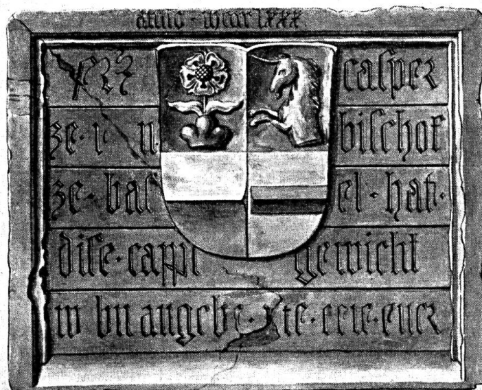
Fig. 98. Skulptur im Kreuzgang des Basler Münsters.

Im Kreuzgang des Basler Münsters findet sich, in die Brüstung des östlichen Geviertflügels eingelassen, eine ziemlich verwitterte Wappentafel, deren Schild und Inschrift schlecht beleuchtet und kaum zu entziffern sind. Es zeigt sich ganz offensichtlich, dass das schmucke kleine Kunstwerk nicht für die Stelle geschaffen wurde, an der es sich heute befindet. Dies bestätigt uns denn auch eine, aus Ver-