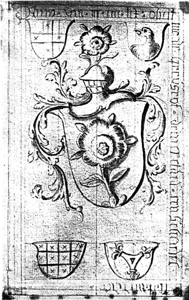
Fig. 100. Grabplatte der Familie Rot, einst in Thann.

Die Wappentafel in Rammersmatt weist deutlich auf die Abtwürde von Friedrich Rot hin, einmal durch den Abtsstab hinter dem Schild, sodann durch die