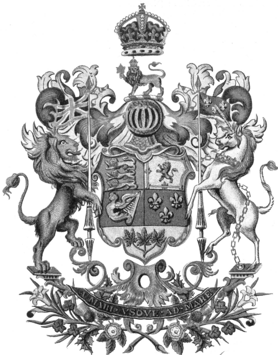
Fig. 21. Les armoiries du Canada. ✓

dans un même écu les armes des neuf provinces. On sentait depuis longtemps que cette pratique était défectueuse ; aussi une commission fut-elle chargée de composer de nouvelles armoiries, et le choix qu'elle a fait a été approuvé par le gouvernement du Canada et sanctionné par le roi.