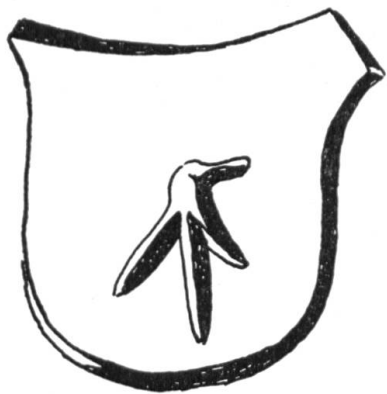
Fig. 15 Pierres sculptées à Cerniaux s/Gléresse. XVI e siècle.

On sait la grande variabilité des armoiries paysannes ou bourgeoises suisses aux siècles passés. Le fils porte souvent un écu absolument différent de celui de son père ; le même personnage peut même parfois employer trois ou quatre sceaux distincts, soit empruntés, soit créés de toutes pièces. Il est piquant de voir que, dans certains cas, on