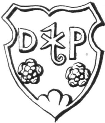
Fig. 22. Pierre sculptée à Saint-Blaise. Daniel Prince. 1648.