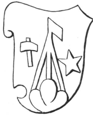
Fig. 21. Armes de Jacques-Frédéric Beljean. Début XIX e siècle.