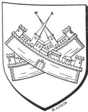
Fig. 7. Villecroze (Var).

De gueules au château à trois tours crénelées d'argent posé en chef, accompagné en pointe d'un tarasque ou dragon monstrueux à six pattes de sinople le dos couvert d'écaillés d'or dévorant un homme vêtu du même, les bas d'azur et les souliers de sable. Interprétation moderne d'un blason sculpté datant du XV e siècle. Armes parlantes.