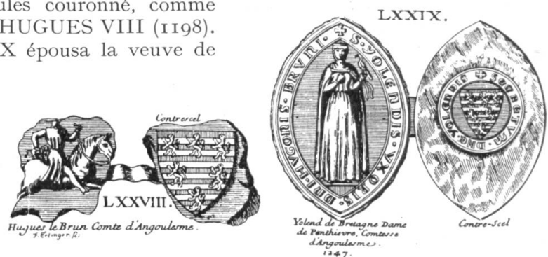
Fig. 3. Sceaux d'Hugues le Brun de Lusignan, comte d'Angoulesme et d'Yolande de Bretagne, sa femme.

Ont usé d'un sceau identique (6 lions) : GUY (1283), frère de HUGUES XII, et un autre GUY (1301), frère de HUGUES XIII (décédé en 1302).