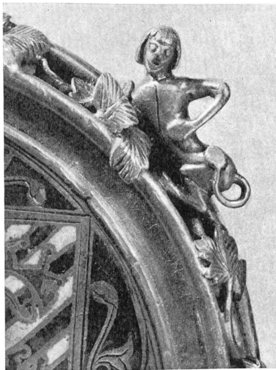
Fig. 2. Personnage à arrière-train de lion et queue spatulée de poisson. Probablement image de la fée Mélusine.

Ce sera HUGUES IX, comte de la Marche en 1190, qui reprendra aux Anglais le domaine des Lusignan. Epousa MATHILDE, fille et héritière de Vulgrin, comte d'Angoulême. Compagnon de Richard Cœur de Lion à la croisade. Meurt vers 1208.