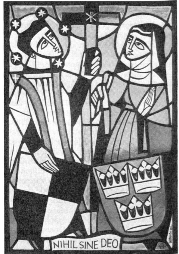
Abb. 5. Wappenscheibe Hohenzollern-Bernadotte, 1961.

Wappenscheibe Hohenzollern - Bernadotte. — Anlässlich der fürstlichen Hochzeit zwischen S.H. Prinz Johann Georg von Hohenzollern und I.K.H. Prinzessin Birgitta von Schweden in Sigmaringen im Mai 1961 wurde ein kleines Wappenfenster für die Münchener Villa des jungen Ehepaares gestiftet. Die Scheibe ist von dem schwedischen Künstler Bengt Olof Kälde gezeichnet und ist in der Franz Mayer'schen Hofkunstanstalt in München ausgeführt. Abgebildet sind die beiden Namenspatrone mit den Wappenschildern von Hohenzollern und Schweden. Rechts der heilige Johannes von Nepomuk, der Prager Beichtpatron, in Chorrock und Stola mit einem Kreuz in der linken Hand und mit der rechten den Schild haltend. Links die heilige Brigitte von Wadstena, die bekannte schwedische Ordensgründerin, in Witwentracht und mit einer Feder in der Hand. Unter den Wappen ist der Wahlspruch der Hohenzollern-Sigmaringen — Nichts ohne Gott. (Abb. 5).