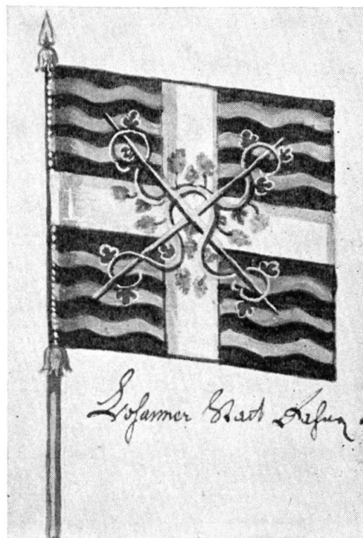
Abb. 2. Fahne der Stadt Lausanne.

Auf Blatt 10 sind drei Geschützrohre in Gelb und Gold gemalt. Daneben die Legende: « 2 Grosse feldt stückh. A° 1646 in Brysach gegohsen. Darauf geschriben Hanss Ludwig von Erlach herr auf Castellen und Gubernator in Breÿsach. — 6 kleine stückh mit buchstaben A: B: C: G: H: L: gohsen A° 1.6.3.6.2 kleine gar subere stückhlin, mit läublin und zweÿ kleine Bärner schiltli.