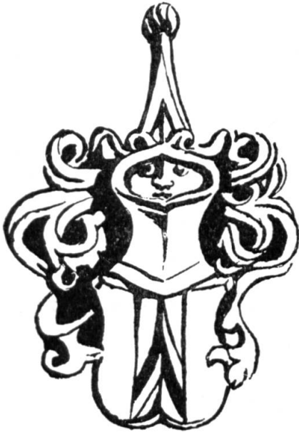
Fig. 7. Armes d'Erlach XV e siècle.

Une singularité héraldique. — Le visiteur de la Collégiale Saint-Vincent à Berne découvre avec plaisir les nombreux monuments héraldiques qui décorent ses murs et son mobilier. Dans la chapelle de Krauchtal, un chapiteau supporte les armoiries de la famille d'Erlach sculptées à la fin du XV e siècle. L'écu, de gueules au pal d'argent chargé d'un chevron de sable , est sommé d'un heaume ouvert à l'intérieur duquel apparaît le visage d'un homme qui contemple le passant d'un œil fixe et courroucé (fig. 7). Un second exemple de ce casque habité se trouve au-dessus de la porte du château de Spiez. Le seigneur du lieu, François-Louis d'Erlach, y fit apposer en 1601 une élégante composition à ses armes unies à celles de sa première femme Salomé Steiger (il eut 35 enfants de ses deux alliances!).