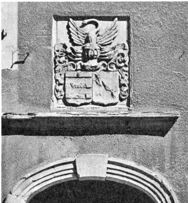
Fig. 2. Portal der « Tour de Mézières » in Coppet mit Allianzwappen Quisard-Chasseur.

Dem aufmerksamen Spaziergänger unter den Arkaden des Städtchens Coppet entgeht eine Sandsteinskulptur wohl kaum, die über dem Portal eines grossen Hauses der Seeseite angebracht ist (fig. 2). Sie stellt ein Allianzwappen dar, das leider den Weg aller Arbeiten in diesem anfälligen Material geht und langsam bis zur Unkenntlichkeit abbröckelt. Es ist deshalb wohl angezeigt, sich näher mit diesem heraldischen Monument zu befassen und es in Wort und Bild festzuhalten.