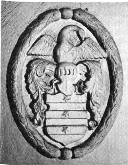
Fig. 3. Wappen Quisard.

515 von Sigismund von Burgund dem Kloster Agaunum (St. Maurice) geschenkt wurde, im 11. Jahrhundert den Grafen von Genf verpfändet war, 1257 an das Haus Savoyen kam und bis ins 16. Jahrhundert nacheinander die Thoyse, Allamandi, Grandson, la Baume, Saluces, Montmayeur, Pollogny, Viry und schliesslich Bern als Herren wechselten sah.