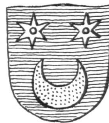
Fig. 6. Wappen Collioud.

Das Allianzwappen über dem Portal ist leider nicht mehr zu retten; die Wappenbilder bröckeln ab und wären nur durch eine Kopie zu ersetzen. Die hübschen Skulpturen der Galerie waren lange Zeit mit graublauer Ölfarbe übermalt. Diese an und für sich hässliche Behandlung hat die Wappen jedoch vor der Verwitterung gerettet. Sie konnten gereinigt und mit einem neuen Anstrich, der Tingierung der Wappen entsprechend, versehen werden. So werden sie der Nachwelt erhalten bleiben und von einer glanzvollen Epoche des schönen Lehensschlosschens in Coppet zeugen.