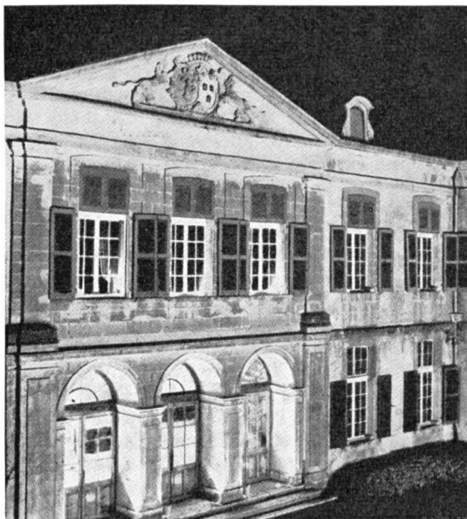
Fig. 5. Allianzwappen Smeth-Kunkler von Schloss Coppet.

Um diese Zeit (1665) erlebte Quisard auch die Umgestaltung der angeblich 1257 von Pierre von Savoyen erbauten Burg Coppet durch den Grafen Dohna. Die Mauern und 3 Türme wurden abgerissen, die Gräben zugeschüttet und gegen Süden ein Ehrenhof angelegt. So wurde