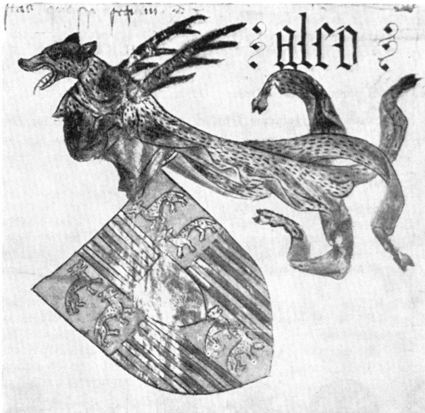
Fig. 1. Armes de Dom Pedro de Meneses, 1431.