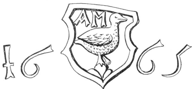
Fig. 1. Armes d'Adam Martin, 1665.

Cette carte 1 comporte un texte qu'il a fallu, faute de place, comprimer et simplifier. Aussi, en hommage à mon collaborateur, j'estime opportun de faire suivre un texte qui, bien