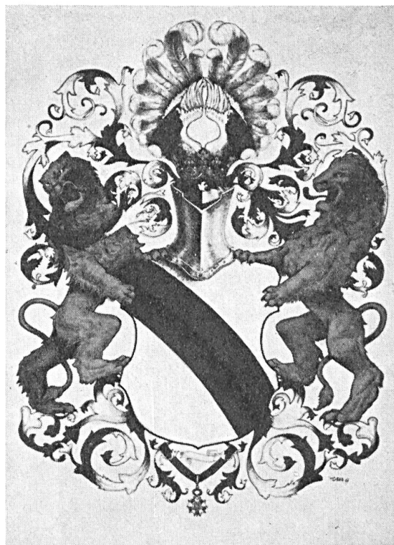
Fig. 7. Grandes armes de Strasbourg, 1967.