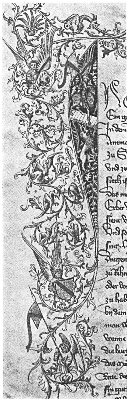
Fig. 3. Armes de Strasbourg sur la Charte constitutionnelle de 1413.

Il est vrai que l'héraldique germanique a, de tout temps, mélangé dextre et senestre dans un souci d'esthétique, les meubles étant facilement contournés pour