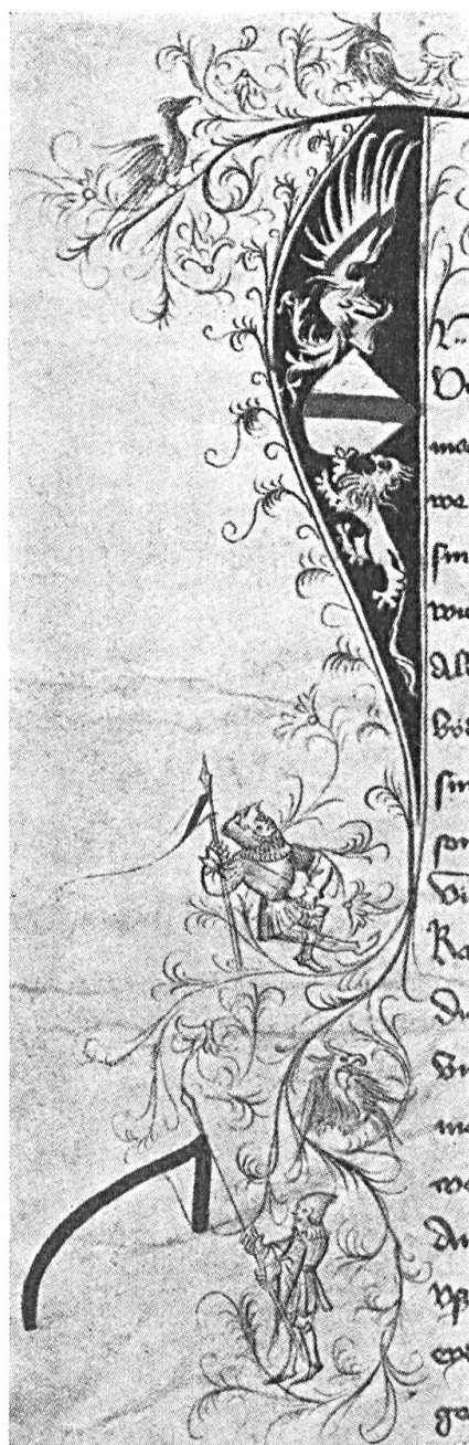
Fig. 2. Armes de Strasbourg sur la Charte constitutionnelle de 1399.

Dès 1340, cependant, la bannière de l'évêché de Strasbourg est d'argent à la bande de gueules au chef dentelé du même