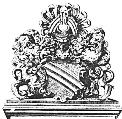
Fig. 5. Gravure aux armes de Strasbourg, 1679.

Le 25 novembre suivant le président Pflimlin nous confia le soin de soumettre à la Conférence de la municipalité un projet qui, dans une facture esthétique et qui tiendrait compte en même temps du droit moderne qu'a la ville de porter en attribut les insignes de la Légion d'honneur, redonnerait à ces grandes armes leur figuration traditionnelle.