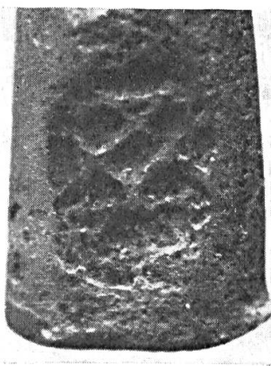
Fig. 1. Marteau aux armes de Joux, XV e siècle.