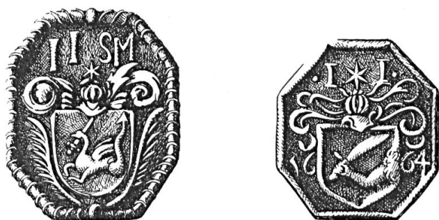
Fig. 1 et 2. Joseph Jacot Guillarmod, 1662, 1664.

Joseph Jacot Guillarmod, né en 1603 à Clermont près de La Chaux-de-Fonds, d'une famille originaire de La Sagne, fit une belle carrière militaire au service étranger. Nous le trouvons en 1645 capitaine au Régiment de la Roque-Bouillac au service de France puis, quelques années plus tard, capitaine des troupes de la République Sérénissime de Venise. Entré en 1657 au service du Roi de Danemark, il a la charge de capitaine de cavalerie au régiment de dragons de Gyl-denøve. En récompense de sa conduite glorieuse lors du siège de Copenhague par les Suédois en 1658-1659, ce régiment fut promu Régiment des gardes de la Reine. Joseph Jacot Guillarmod, dénommé habituellement Joseph Jacob Schwitzer, en raison de son origine, nommé major en 1661, commande dès 1662 la forteresse de Nyborg en Fionie où il paraît être resté jusqu'en