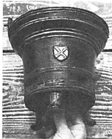
Fig. 1. Bénitier aux armes de Leugney.

L'église de Leugney (hameau de la commune de Bremondans, département du Doubs), si riche en souvenirs archéologiques, possède un bénitier en bronze sur lequel