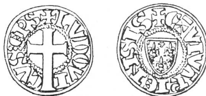
Fig. 6. Denier de Louis de Poitiers.

Deux variantes de ses deniers nous sont connues. Caron a décrit dans la Revue numismatique , 1903 (procès-verbaux, p. xxxiv), un denier de la collection Vallentin du Cheylard portant une croix à branche égale qui dut être frappée sous son épiscopat et avant 1310. La même Revue numismatique , année 1915 (procès-verbaux des séances, p. LXVII, séance du 3 juillet 1915) donne la substance d'une communication faite par M. Bordeaux relative à un denier de Louis de Poitiers alors conservé dans la collection Alfred Manuel : croix à pied traversant la légende † LVDOVI - CVS EPS. Revers : écu semé de fleurs de lis dans un cercle de points : + C = VIVARIENSIS. Poids : 92 g (fig. 6). M. Bordeaux a montré que ce denier — qui ne diffère du précédent que par la croix au pied pénétrant dans la légende — est inspiré du type du « nouveau bourgeois » (frappé à la suite de l'ordonnance de Philippe IV du 27 jan-