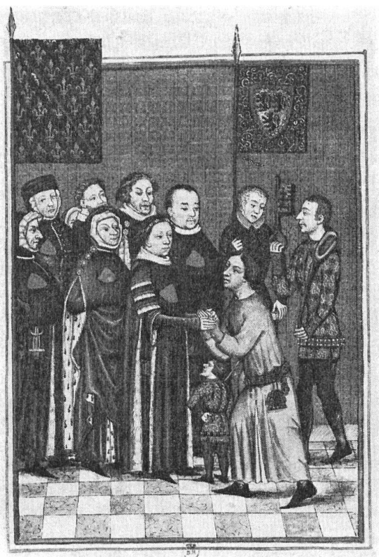
Fig. 5. « Louis II du nom duc de Bourbon, instituteur des chevaliers de l'escu d'or dit de Bourbon en 1369, reçoit un hommage accompagné de ses chevaliers. Tiré d'une vignette des hommages du comté de Clermont qui est à la chambre des comptes de Paris. » Copie de la collection Gaignières. Paris, Cabinet des estampes.

honorés de le devenir de la main du duc de Bourbon.