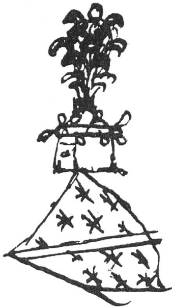
Fig. 2. Ecu surmontant l'oriel de l'hôtel de Bourbon. Dessin du registre de Peiresc.

Par dessus ce couronnement qui est couvert de plomb en demy pavillon, les armes de Louys II duc de Bourbon qui fit bastir la maison y sont portées en l'air revestües de plomb doré. Lesquelles consistent en un grand écu (semé de fleur de lis au baston de Bourbon) suspendu en penchant à un tronc de fer qui supporte le heaume doré fait à l'antique en forme aiguüe par le feste, aboutissant à un bouquet [l'auteur avait d'abord écrit « d'où sort une », qu'il a rayé et remplacé par :] ou trousse de queue de paon. Et pour couronne, il y a un petit bourrelet garny de quelques feuilles qui semblent aucunement feuilles de Laurier [l'auteur a rayé ensuite : « si ce n'est que ce soit une couronne qui ayt esté »] gasté par succession de temps, et par l'injure des pluyes, vents et tempêtes auxquelles elle est bien exposée.