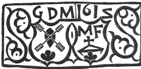
Fig. 1. Georges de Montmollin et Marguerite Favarger, 1612.

Un beau fer à gaufres de 1612 est propriété de M. André Tissot à La Chaux-de-Fonds. Il est taillé aux armes de Georges de Montmollin, 1580-1634, maître bourgeois de Neuchâtel et lieutenant du maire de la ville, et de Marguerite Favarger, sa femme épousée en 1600. Le blason parlant du mari porte un moulin à vent accompagné en pointe d'un mont de trois coupeaux, celui de sa femme, un triangle évidé sommé d'une croisette, également accompagné en pointe d'un mont de trois coupeaux (fig. 1). De ce couple descend toute la famille de Montmollin dont on voit ici la première apparition des armoiries.