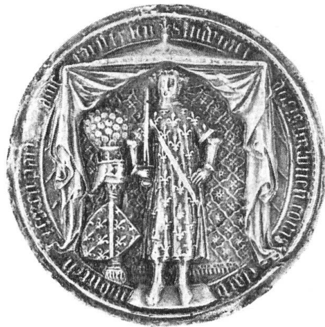
Fig. 3. Sceau de Louis II de Bourbon en 1394. Le duc est debout sous une tente, nu-tête, vêtu d'une longue cote d'arme et tenant son épée de la main droite. A côté de lui une colonnette torse — sur un piédestal où l'on peut encore lire sa devise ALLEN — supporte l'écu de Bourbon et le heaume à lambrequins, couronné, et cimé d'un plumail de paon. Cimier attesté par les armoriaux et en particulier par Gelre.

3 o Le dessin du registre de Peiresc — document unique — prouve que le graveur du grand sceau, dont usa Louis II à la fin de sa vie 7 , avait reproduit la composition héraldique qui surmontait l'hôtel de Bourbon (fig. 3).