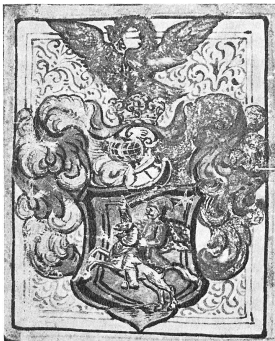
Abb. 8. Iwankovich, 1643.

schwingend; in der linken oberen Ecke des Schildes ein sechsstrahliger g Stern. HZ : ein nat. Pelikan in g Neste sitzend, füttert mit seinem Blute seine 3 Jungen. D : B-G, R-S. Publ. Kom. Vas. BALOGH S. 206. Orig. Nr. 31. (Abb. 8).