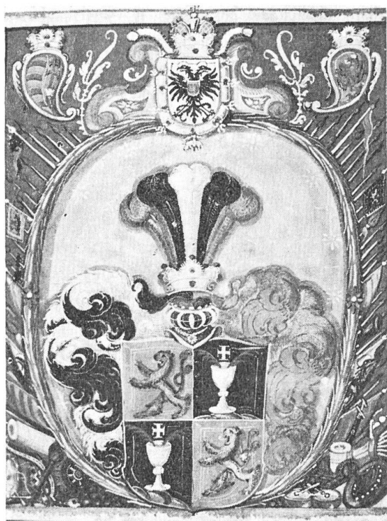
Abb. 7. Friedrich, 1641.

schwingend; in der linken oberen Ecke des Schildes ein sechsstrahliger g Stern. HZ : ein nat. Pelikan in g Neste sitzend, füttert mit seinem Blute seine 3 Jungen. D : B-G, R-S. Publ. Kom. Vas. BALOGH S. 206. Orig. Nr. 31. (Abb. 8).