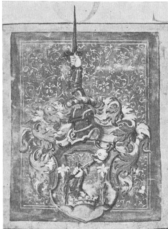
Abb. 5. Horváth aliter Munchych, 1581.

Wulst wächst der gepanzerte Arm heraus, aber das s. Schwert ist leer. D : R-S, B-G. Publ. : Kom. Vas 1582. Orig. Nr. 42. (Abb. 5).