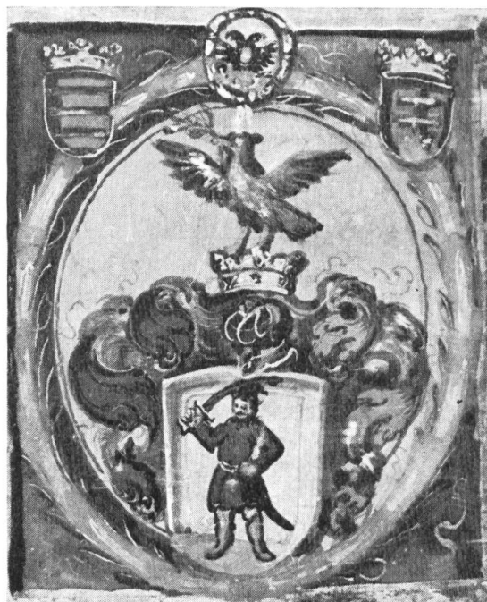
Abb. 10a. Smolcz, 1655.