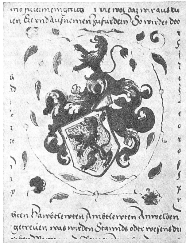
Fig. 3. – Feer (1488)