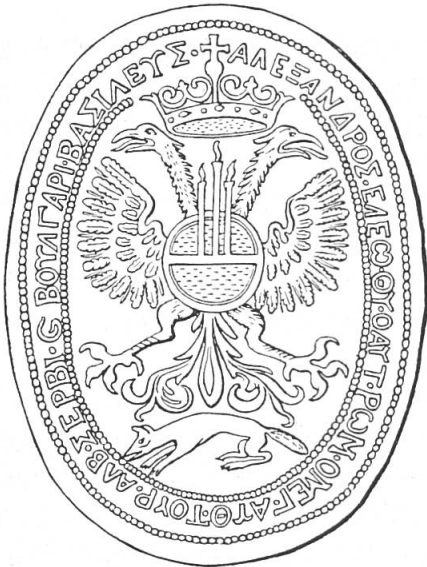
Abb. 2. Angeblicher Siegelstempel des Georg Kastriot, um 1800 in der Türkei aufgetaucht.

dessen Reif in drei brennende Lichter übergeht. Das unter dem Schwanz des Doppeladlers geduckt laufende fuchsartige Tier vermochte auch der in der ost-europäischen Heraldik wohlbewanderte Freiherr von Koehne nicht sicher zu deuten. Wir vermuten einen Zusammenhang mit dem Marder des slawonischen Wappens, der auf die balkanische Münzeinheit «kuna» (d. h. Marder) und das entsprechende Münzbild zurückgeht. Die Umschrift in griechischer Sprache lautet (mit Koehne's Ergänzungen): ΑΛΕΞΑΝΔΡΟΣ · ΕΛΕΩ · Θ(εο)Υ ΟΑΥΤ(οκρατωρ) · ΡΩΜ(εων) · ΟΜΕΓ(ας) · ΑΥΘ(οκρατωρ) · ΤΟΥΡ(κων) · ΑΔΒ(αγιας) · ΣΕΡΒΙ(ας) · Γ(statt και) · ΒΟΥΛΓΑΡΙΑ(ας) · ΒΑΣΙΛΕΥΣ · (Alexander von Gottes Gnaden Selbstherrscher der Römer, Gross-Selbstherrscher der Türken, von Albanien, Servien und Bulgarien König.)