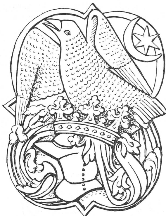
Fig. 7. Emblème personnel de Iancu de Hunedoara, château de Hunedoara, 1452.

Iancu de Hunedoara (Jean Hunyadi, en hongrois), voïvode de Transylvanie, 1441-1446, régent de Hongrie, 1446-1453, a été le brillant champion de la lutte contre l'expansion ottomane ce qui lui valut le