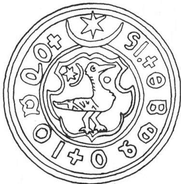
Fig. 1. Sceau de Cîmpulung-Muscel, vers 1300, Valachie.

Basarab I er , fondateur en 1310 de la dynastie nationale des Basarab, princes de Valachie, avait sa résidence dans la ville de Cîmpulung. Le sceau de cette ville du district de Muscel, datant de 1300 environ, est le plus ancien sceau de Valachie. Il est chargé d'un corbeau contourné, accompagné d'une part d'une étoile et d'un croissant et, d'autre part, d'une ombre de soleil (fig. 1). Le corbeau était l'oiseau saint du dieu Mithra (le soleil invincible) d'origine persane, adoré en Dacie, symbolisant la lutte entre le bien et le mal. Il semble que cet oiseau soit devenu l'emblème de la Valachie et de ses premiers souverains.