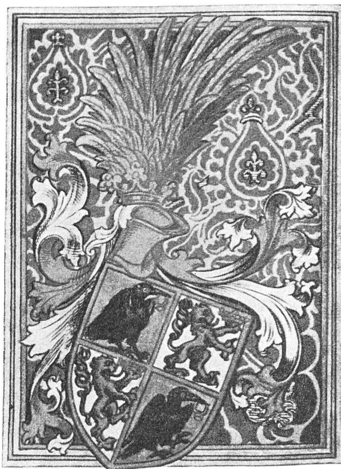
Fig. 8. Augmentation d'armoiries pour Iancu de Hunedoara, diplôme de 1453.