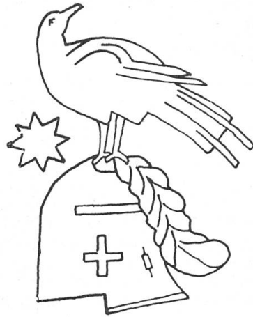
Fig. 2. Vladislav I er Basarab (1364-1377), monnaie de 1365, Valachie.

Le corbeau, posé sur un heaume, apparaît comme cimier et symbole du pays sur le revers des premières monnaies d'argent de Valachie frappées en 1365 par Vladislav