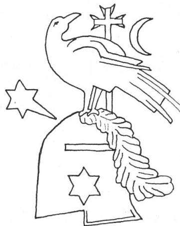
Fig. 3. Rodolphe II Basarab-Plesuvul (1421-1427), monnaie, Valachie.

I er (1364-1377), petit-fils de Basarab I er (fig. 2), puis, sur celles émises par ses successeurs (fig. 3). Le volatile a la tête contournée.