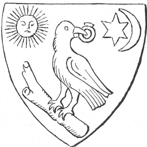
Fig. 4. Dan II Basarab, 1420.

Sur le sceau du Dan II Basarab (1420), l'oiseau posé sur un écot tient une bague dans le bec et est accompagné d'un soleil, d'une étoile et d'un croissant (fig. 4) 5 .