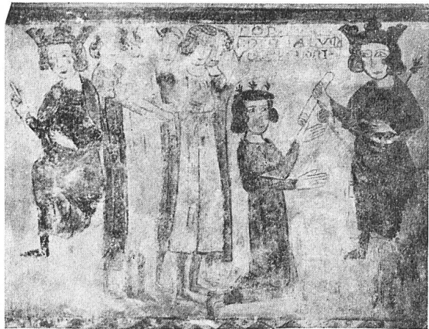
Fig. 4. L'investiture par le roi à un seigneur.

rouge et d'un manteau jaune. Le seigneur qui reçoit l'investiture porte une robe rouge et un curieux chapeau plat, sans bord, sommé de trois fleurons beaucoup plus petits et très différents de ceux de la couronne royale (fig. 6, 7). Derrière lui un groupe de cinq seigneurs en robes longues,