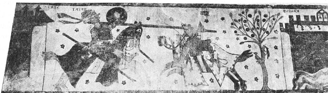
Fig. 5. Le combat singulier contre un Sarrazin.

Tout le registre supérieur est occupé par un autre combat singulier à la lance (fig. 5). A gauche, un payen à peau noire, le front ceint d'une écharpe, sans casque avec un bouclier rond et un dragon vert sur la housse rouge de son cheval, reçoit un coup de lance dans le cou et perd son équilibre. Au-dessus de sa tête est écrit IAIAR et, à côté de la ville dont il sort PARIS. Le chevalier vainqueur sort d'une