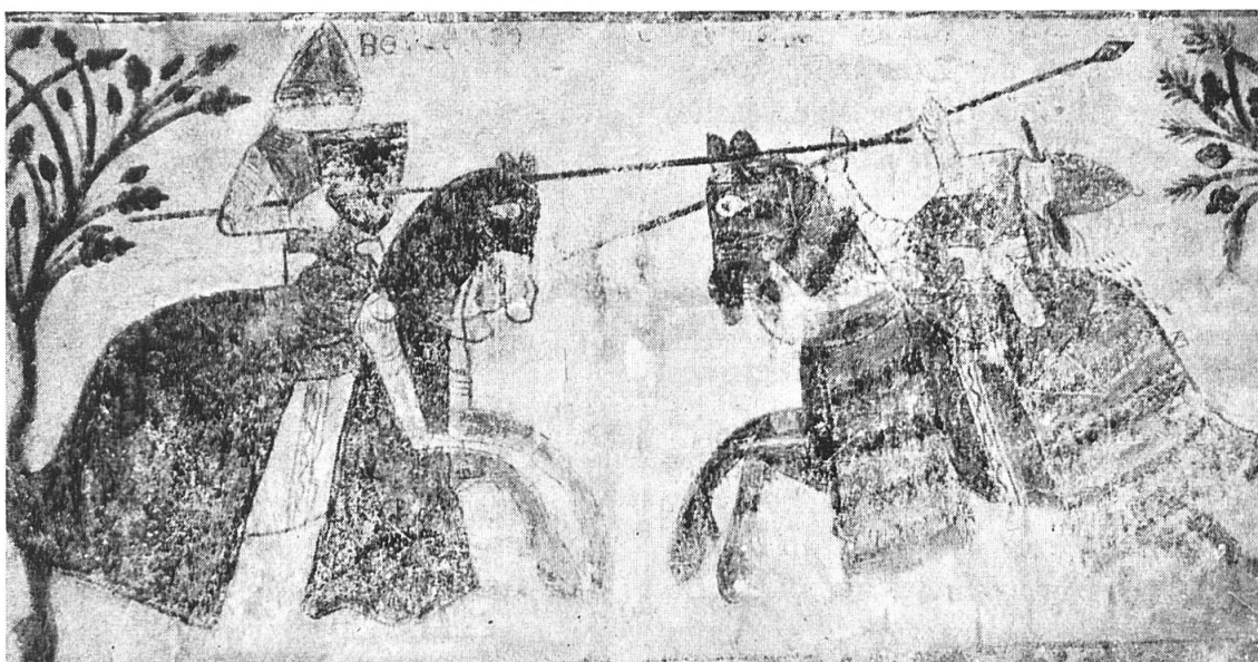
Fig. 3. Le combat singulier au cours de la bataille.

par Charles, reconnaissable à sa couronne (fig. 6, 4) et à la housse armoriée de son cheval, celui de droite par l'héritier de Frédéric II couronné, tenant l'écu de l'Empire ( d'or à l'aigle sable, becquée et membrée de gueules ). La housse du cheval porte les mêmes armes. Quelques chevaliers sont déjà à terre, entre les pieds des chevaux, mais cette partie de la scène est en très mauvais état. A côté du roi un personnage au casque conique chargé d'une croix tréflée (fig. 6, 5), brandit son épée. Son cheval a une housse rouge. Derrière le chef adverse, un chevalier porte des armes coticées d'or et de gueules . Au-dessous du groupe de gauche, on croit pouvoir lire EXERCITUS KA(rol) mais on lit bien, tout à fait à droite, EXERCITEUS CONRADINI.