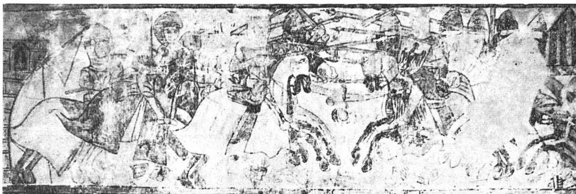
Fig. 2. La bataille.