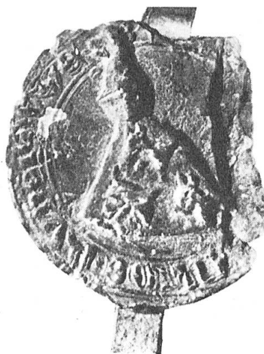
Abb. 3. Wipertus miles dictus Rude (de Rudenawe), 1293.