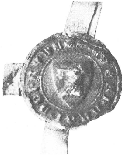
Abb. 6. Eberardus dictus Rude miles (Collenberg) 1328, 1338.

der nächsten Generation ausgestorben zu sein, während der Ast des WIPERTUS mit dem einen Rüdengkopf noch heute besteht. Besagter WIPERTUS teilte 1306 seinen nicht unbeträchtlichen Besitz – Allode, Lehen, Rechte und «homines» in nicht weniger als 39 Ortschaften – unter seine vier weltlichen Söhne auf. Ein fünfter, FRIDERICUS, war Kanoniker zu Würzburg. Zwei Brüder CONRADUS (der älteste) (Abb. 5) und HENRICUS (der jüngste) erhielten eine Hälfte, meist Urbesitz mit der Burg Collenberg (Allod). Die beiden mittleren WIPERTUS und EBERHARDUS (Abb. 7) die ander Hälfte mit der Burg Bödighheim (ebenfalls Allod). Es bildeten sich somit zwei Linien mit je zwei Ästen,