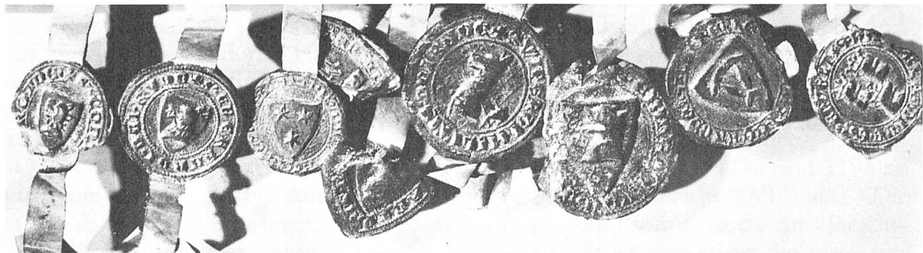
Abb. 9. I. Conradus dictus Rude miles (Collenberg). II. Eberardus dictus Rude miles frater ejus (Collenberg). III. Fridericus dictus Rude cantor novi monasterii eccl. herbipolensis. (Collenberg). IV. Wipertus dictus Rude miles (Bödighcim). V. Eberardus dictus Rude miles frater ejus (Bödighcim). 1328.

Als Beweis, dass das Gittermuster mit den Kreuzen (oder Punkten) nicht immer eine «Damaszierung» ist, geben wir in der Abb. 10 das Fragment eines römischen Grabsteines wieder, aus welcher klar ersichtlich wird, dass es sich um einen «heraldischen» Hauptbestandteil handeln kann, der keine andere Teilung oder Figur benötigt. Wäre es möglich, dass in heraldischer Zeit auf diese Weise eine Differenzierung erfolgt wäre? Es wäre interessant,