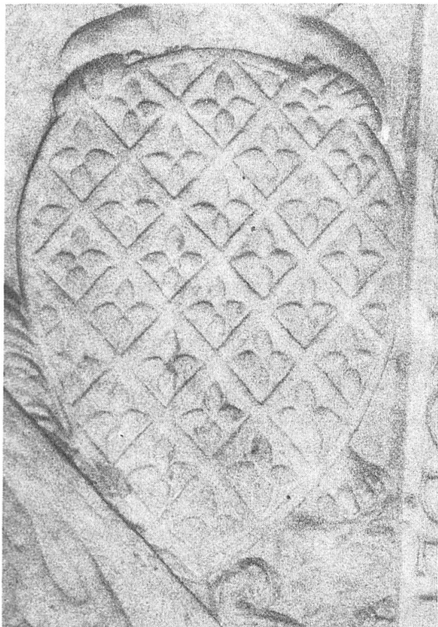
Abb. 10. Römisches Grabsteinfragment.

zu wissen, ob die Heraldiker auf ähnliche Fälle gestossen sind!