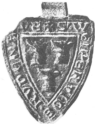
Abb. 4. Wipertus miles de Rudenawe, 1302.