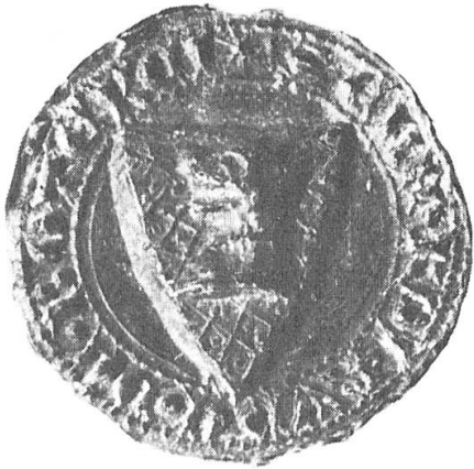
Abb. 8. Eberardus miles Rude de Botenkeim, 1313, 1316, 1328, 1335.

die sich von nun an DE COLLENBERG und DE BOEDIGHEIM nannten. Beide vermehrten sich gewaltig, und es finden sich von nun an in jeder Generation einige Wiperti, Eberhardi (Abb. 6, 8), Conradi, Dietheri und Henrici (Abb. 9), die alle einen Rüdencopf im Schilde und auch als Helmzier im Siegelrund führten.