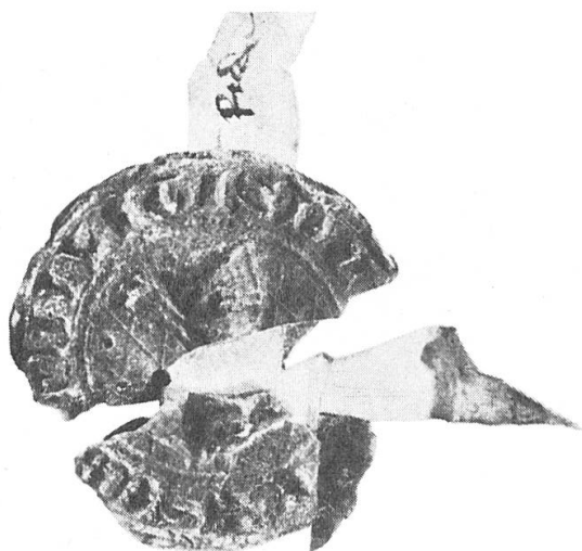
Abb. 7. Eberhardus miles dictus Rude (Eberhard Ritter Rude von Bödenkeim), 1338, 1338, 1340.