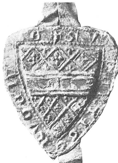
Abb. 2. Wipertus miles senior dictus Rude de Rudenawe, 1285, 1286.

Die Gleichheit der Vornamen – wir haben zum Beispiel in der zweiten Hälfte des 13. Jahrhunderts mindestens vier verschiedene dokumentierte «Wiperti», erschwert in einzelnen Fällen die genaue Zuschreibung einer Urkunde zu der einen oder anderen Person. Die Besitznamen geben ihrerseits wenig Handhabe, da sie alle als «Condomini» erscheinen. Die Filiationen sind hingegen alle urkundlich belegt.