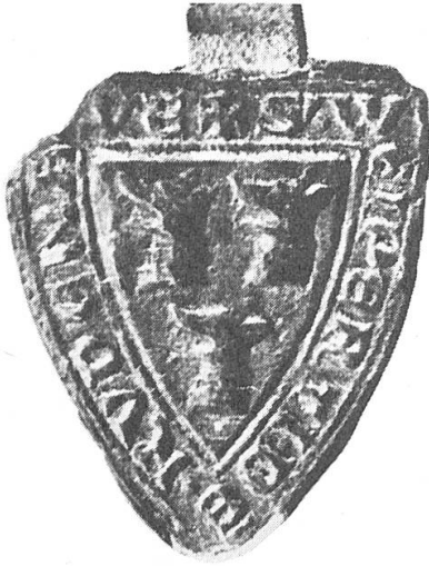
Abb. 4. Wipertus miles de Rudenawe, 1302.