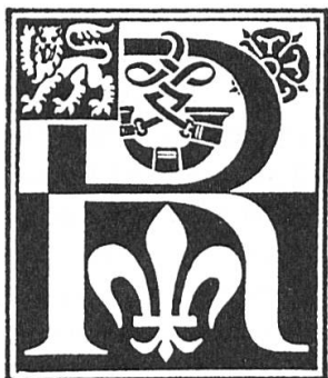
Fig. 1. Lettrine R aux armes de P. P. Rubens (R. Harmignies, del.)

Eine summarische Einleitung ohne jede Quellenangabe berichtet über die Geschichte des Arlbergs, des von dem wirklichen Findelkind Heinrich Findelkind gegründeten Hos-