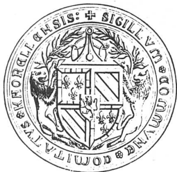
Fig. 1: Sceau de la cour du comté de Charolais. Gravure insérée dans la Description... du duché de Bourgogne de Courtépée.

Le sceau de la cour du comté de Charolais avait un diamètre de 52 mm, c'est-à-dire qu'il était notablement plus grand que ceux habituellement utilisés par les juridictions ducales.