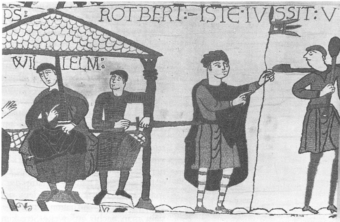
Abb. 3. Hier erscheint Rotbert zweimal: bei der Beratung im Hause und — mittels des gleichen Tricks wie in Nr. 1 durch das hinweisende Schwert bezeichnet — als Befehlshaber mit dem Wimpel Wilhelms, als Zeichen, dass er in seinem Namen handelt. Auch in der Begleitschrift erscheint eine Spitze, die unter «Rotbert» und «ISTE» ein und dieselbe Person deuten lässt.

Weise wiederholen: in einem quadratischen hellen (= weissen) Felde ein terrakotta-rotes Kreuz und ein blau-grünes Bord. Von den Ausnahmen wird der eine Wimpel von Wilhelm, dessen Name darüber steht, selbst gehalten, als ihm ein Kundschafter über Harolds Heer berichtet (Abb. 2). Den anderen Wimpel hält ein Edler, der in einer der vorausgehenden Szenen den Auftrag zur Erbauung des Lagers erteilt. Es handelt sich meines Erachtens um Rotbert, mit dem und mit Odo sich vorher Wilhelm im Hause beraten hat. Das von Rotbert dort waagrecht gehaltene Schwert zeigt bewusst aus dem Hause heraus und berührt den Edlen. «Iste» = jener da — so sagt die Beischrift — bestätigt die beiden Ritter als Rotbert. Zum Zeichen, dass er im Auftrage des Herzogs spricht, hält er dessen Lanzenflagge (Abb. 3).