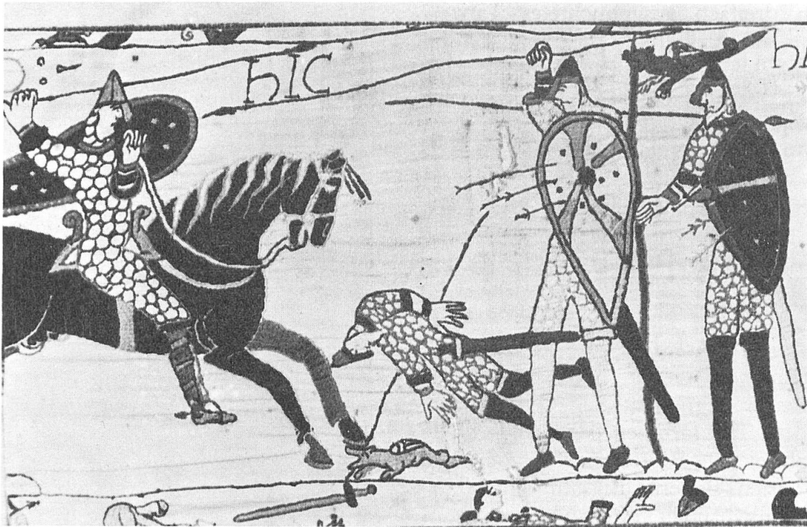
Abb. 1. Ausschnitt aus der Darstellung der Schlacht an ihrem Wendepunkte. Noch steht der Träger der Heeresfahne, eines Drachens an starker Stange. Sinnbildhaft für die Niederlage der Engländer ist der Fahnenträger noch einmal gezeichnet, wie er fällt und das Pferd eines normannischen Ritters seinen Fuss auf den Drachen setzt. Dass es sich dabei um ein und dieselbe Figur handelt, erweist die dünn und hell gezeichnete Drachenfahne und die eigenartige Lage des Schwertes, das richtiger Weise hinter dem nächststehenden Krieger erscheinen müsste.

durch Nieten erfolgt zu sein, die auf der Vorderseite als Metallbuckel sichtbar werden. Einige Schilde lassen über dem Handgriff noch einen weiteren offenbar verstellbaren Riemen erkennen, der es ermöglichte, beim friedlichen Marsche den Schild über den Rücken zu hängen.