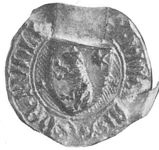
Abb. 1. Siegel des Klaus von Rüdli I., Landammann zwischen 1398–1417. Original im Staatsarchiv Obwalden, ø 30 mm.

Bei dieser Suche nach geschichtlich begründeten Motiven stiess man auf das Siegel des Klaus von Rüdli I., der von 1398–1417 mehrmals als regierender Landammann bezeugt ist (Abb. 1) 6 . Er entstammte einem reich begüterten Optimatengeschlecht, dessen Stammsitz das Rüdli zu Sarnen ist. Das Wappenbild zeigt bei unbekanntem Farben ein steigendes Lamm mit einem sechsstrahligen Stern in der heraldisch linken Oberecke. Der Sohn Klaus von Rüdli II. war zwischen 1431 und 1453 ebenfalls mehrfach