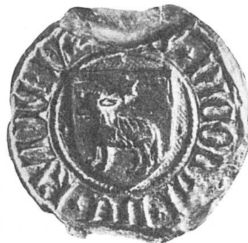
Abb. 2. Siegel des Klaus von Rüdli II., Landammann zwischen 1431–1453. Original im Staatsarchiv Obwalden, ø 30 mm.

Landammann und durch sein vorerwähntes Testament um Kägiswil sehr verdient. Sein Wappen (Abb. 2) 7 enthält dieselben Attribute, doch ist das Lamm schreitend dargestellt und in der Mitte vom Stern überhöht 8 .