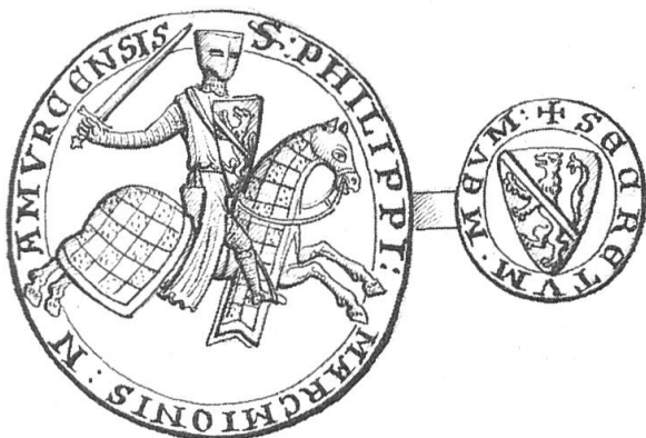
Fig. 6. Sceau et contre sceau de Philippe marquis de Namur dessinés au XVII e siècle pour Roger de Gaignières

Au XVII e siècle, lorsqu'il était encore intact, ce sceau avait été dessiné 9 pour Roger de Gaignières en bas d'une transcription de l'acte (fig. 6).