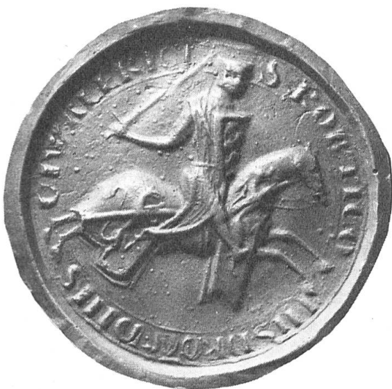
Fig. 1. Sceau de Robert III comte de Dreux.

A la suite de sa description des armoiries de la housse, Douet d'Arcq dans sa Collection de sceaux indique, entre parenthèses, le nom de Saint Valery, dont Robert III de Dreux possédait le fief. C'est là une erreur, étonnante d'ailleurs, car, dans la première partie de l'ouvrage, intitulée Eléments de sigillographie , rédigée vraisemblablement en grande partie par Germain Demay 4 , il est dit: «Nous devons signaler une exception au type ordinaire du sceau équestre aux armes, exception que nous regardons comme fort rare et qui se trouve sur le sceau de Robert III comte de Dreux, de l'an 1225. Sur le bouclier se voient les armes de Dreux (échiqueté d'or et d'azur à la bordure de gueules) et sur la housse du cheval un lion brisé d'un bâton. On remarquera, en passant, que ce lion