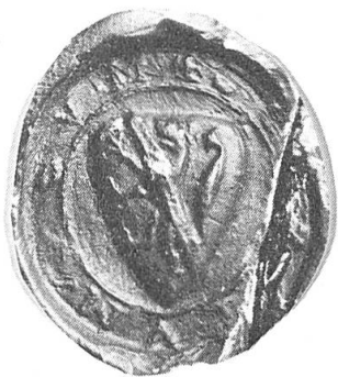
Fig. 5. Contre sceau de Philippe marquis de Namur.

pant brisé d'un bâton en bande. La légende est +SECRETVM.MEVM. (fig. 5).