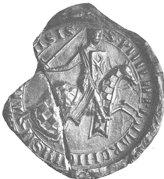
Fig. 4. Sceau de Philippe marquis de Namur.

A un acte du mois d'avril 1222, intitulé au nom de Philippe marquis de Namur 8 , est encore appendu, sur lacs de soie rouge, un sceau rond de 80 mm de diamètre, malheureusement brisé au tiers inférieur gauche (fig. 4).