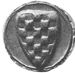
Fig. 2. Contre sceau de Robert III comte de Dreux.

Ce sceau est doté d'un contre sceau armorial qui montre les armes classiques des Dreux, sans légende (fig. 2). Ce sceau 3 est appendu à un acte portant transport au roi de quatre muids de blé, donné à Paris en janvier 1225.