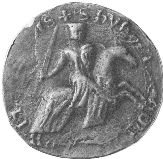
Fig. 7. Sceau de Hugues III comte de Rethel.

L'écu et le contre sceau sont donc aux armes des Rethel tandis que les bars adossés constituent les armes parlantes de la maison de Bar. Avec qui Hugues III de Rethel avait-il précisément échangé ses armes ? Il n'est pas possible de le dire, aucun des sceaux des comtes de Bar ou des autres maisons portant