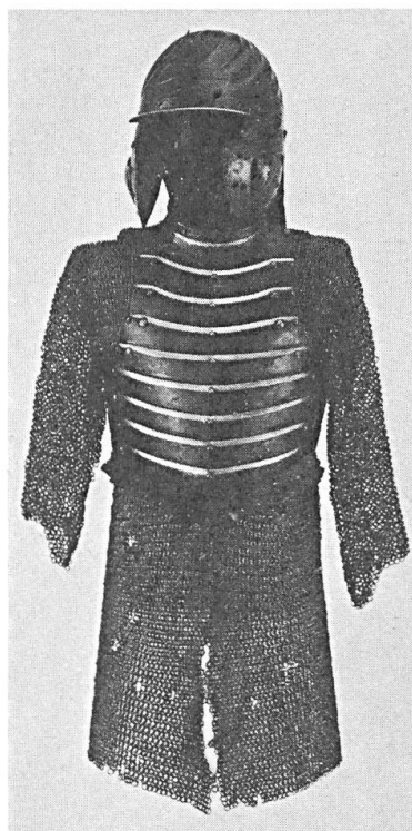
Abb. 3. Offener Helm, kleiner Brustpanzer und Kettenkleid. (Nationalmuseum Budapest.)

kolben (Buzogány) bewaffnet. Die Waffen wurden von nachreitenden Freunden oder einem Bedienten getragen. Diese Waffen waren: ein langer, aber leichter Spieß (Kopja), meistens mit einem kleinen Fähnlein versehen (Abb. 1), ein Säbel (Abb. 2), der offene Helm, manchmal noch ein kleiner Brustpanzer (Abb. 3) und eine leichte Tartsche.