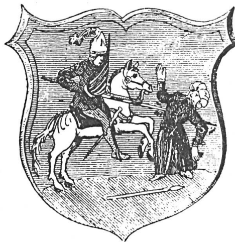
Abb. 1. Darstellung des leichten Spießes (Kopja) in der ungarischen Heraldik. (Nationalmuseum Budapest.)

verschafft. Wenn auch dies nichts nützte, erfolgte die Überreichung eines abgeschnittenen Schweineschwanzes, was bei den mohammedanischen Türken als höchste Beleidigung galt. Eine solche Herausforderung nicht anzunehmen bedeutete den militärischen Ehrverlust. Wenn sich aber beide Partner als tapfere und höfliche Krieger erwiesen, war es Sitte, sich vor dem Kampf gegenseitig zu beschenken, meistens handelte es sich um bei Turnieren brauchbare Gegenstände: Schöne Federn, Waffen, Stiefel, Pferdezeug usw. Der Kampfplatz wurde sorgfältig ausgewählt, meistens auf frischem Rasen oder auf dem Eis des zugefrorenen Plattensees. Es wurde vereinbart, wieviele Zuschauer von beiden Seiten anwesend sein durften. Die Vereinbarungen und die Bewaffnung der Kämpfenden wurden von den gemeinsam erwählten Kampfrichtern sorgfältig überprüft. Der Aufzug zum Kampf geschah zu Pferde, die Kämpfenden trugen beste Festkleidung und waren nur mit einem, ihren Rang bezeichnenden Streit-