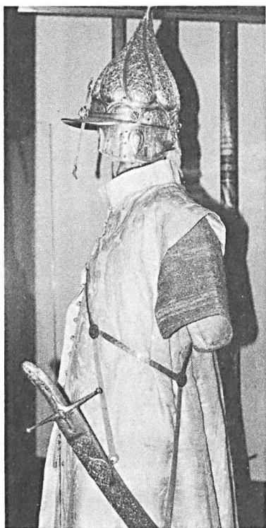
Abb. 4. Die husarische Rüstung des Erzherzogs Ferdinand II. Waffensammlung des kunsthistorischen Museums Wien.

borten eingefasst. Diese Weste ist vorne mit silbernen Knöpfen zu schliessen.