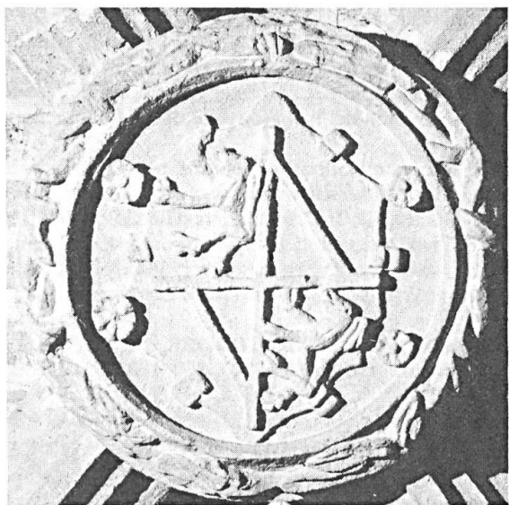
Fig. 6. Clé de voûte de la sacristie de l'église de Pujols-sur-Dordogne.

Les émaux ( lion d'argent sur gueules et bande d'azur sur argent ) sont bien connus dès le XVII e siècle. Plus anciennement ils apparaissent dans divers armoriaux manuscrits. Dans l' Armorial Navarre qui date de la fin du XIV e siècle 4 il y a plusieurs familles de Guyenne parmi les Poitevins (N os 1265-1391) et les Berrichons (N os 1392-1454). Parmi les «banerois» du premier groupe: le sire de Duras, party d'argent à un lion rampant de gueules q. d'azur à un chevron d'argent (N o 1335). On voit que les émaux sont inversés et que la bande s'est transformée en chevron. Il y a bien d'autres inexactitudes de ce genre dans cet armorial. L' armorial d'Urfé (vers 1440) 5 , contient une partie consacrée à la Gascogne (N os 411-468) parmi lesquels le sire de duras partj dargent et de gueles sur le gueles ung lion dargent et suz largent j e bende dazur et sont les armes de durfort (N o 427) et (N o 431) les armes de durfort dargent a le bende dasur . Il faut faire ici deux remarques. D'abord, à cette époque, on blasonne encore souvent le métal avant la couleur 6 , mais, dans le cas du sire de Duras, la suite du blasonnement reprend l'ordre qu'on trouve toujours sur les sceaux. Ensuite, l'écu de Durfort porte la bande seule. Mais alors, d'où vient le lion ?